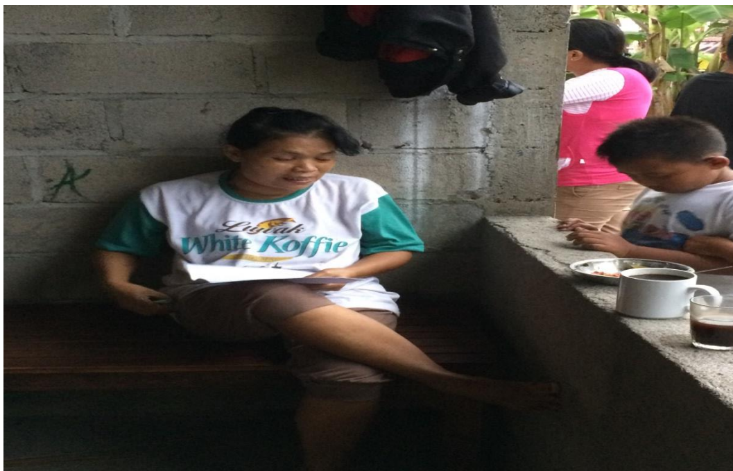
Pembagian angket kuisisioner di Padukuhan Sawahan Rt 02.