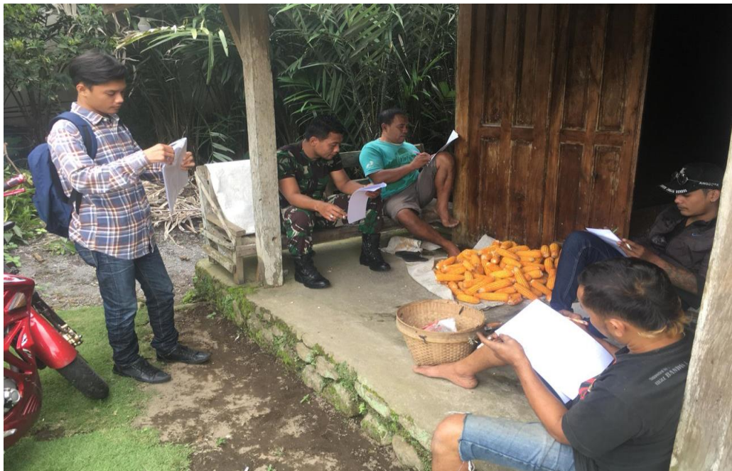
Pembagian angket kuisisioner di Padukuhan Klelen-Tegalsari.