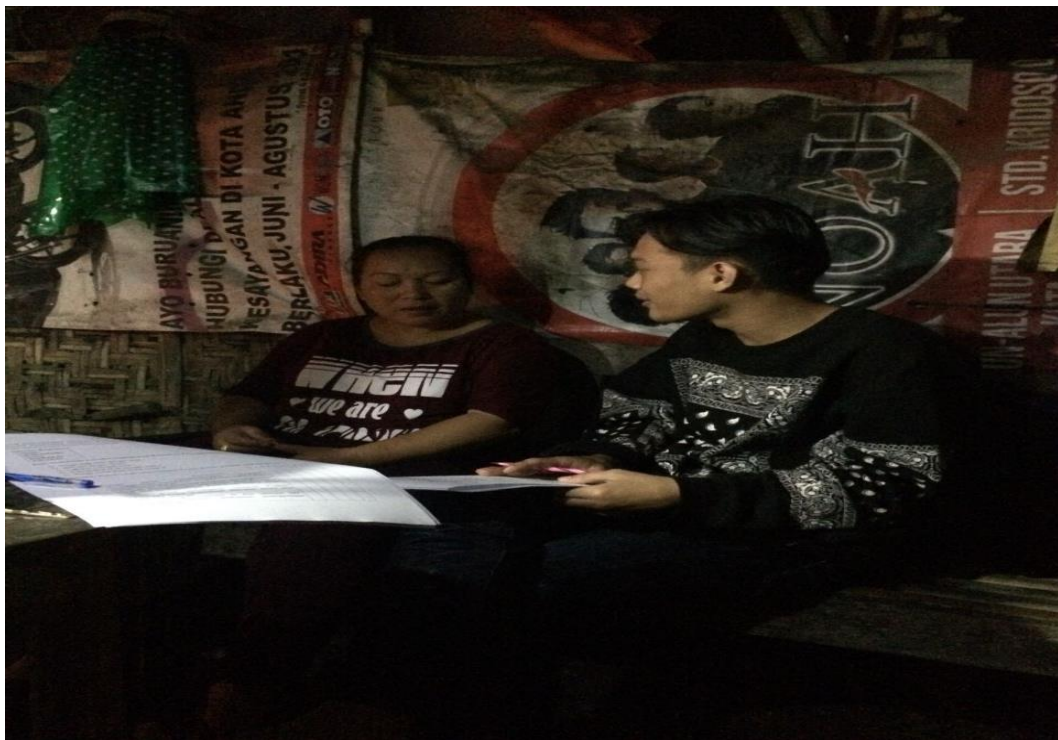
Pembagian Kuisisioner penelitian di Padukuhan Ngaglik Rt 02.