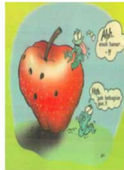
Gambar 3 Hai, 15/9/2000

Gambar 1 terdapat dalam artikel “Lebih Tahu Tentang Seks?” terlihat foto tangan perempuan yang menawarkan buah apel ranum kepada tangan laki-laki sebagai metafora perempuan yang menawarkan kenikmatan pada laki-laki. Gambar 2 dalam artikel “Perjalanan Sperma: Banyak Kesandung Mitos”, menampilkan beberapa makhluk yang mengacu pada sperma sedang mengelilingi buah apel. Satu makhluk ada di dalam buah apel dan tersenyum, menunjukkan nikmatnya berada di dalam apel. Gambar 3 dalam artikel “Ukuran Keperjakaan: Asal Jangan Main-Main Dengan Alat Kelamin”, mengilustrasikan hal yang sama, bahkan makhluk dalam gambar itu menegaskan kenikmatannya berada di dalam buah apel dan berkata, “Ahh... enak bener..!!” Apel adalah simbol seks yang nikmat. Buah apel merah adalah lambang kenikmatan.