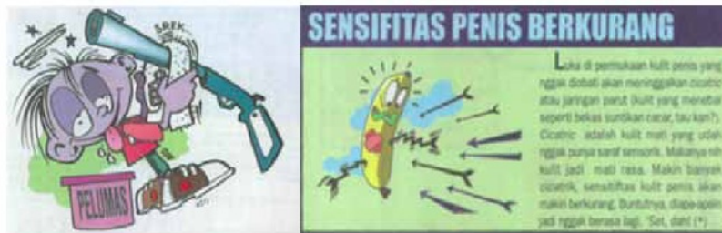
Gambar 9 Personifikasi Penis dalam Hai edisi 12/8/2002

Di saat yang sama kelompok-kelompok masyarakat berbasis gender, etnis dan agama yang termarginal di masa Orde Baru mulai tampil dan memiliki pengaruh yang cukup penting, misalnya kelompok-kelompok Islam. Pada masa pemerintahan pasca Suharto berlangsung proses Islamisasi dengan pola yang kompleks. Muncul kelompok-kelompok Islam yang klasifikasi ideologinya tidak lagi hanya berdasarkan kategori modernis dan tradisional, namun terpecah lagi dengan munculnya kategori baru, yaitu liberal dan militan (Van Wichelen, 2007:96).