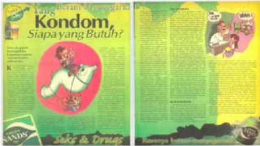
Gambar 6 Hai edisi 16/4/2001