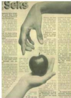
Gambar 1 Hai, 15/10/1996

Dalam majalah Hai dijelaskan, seks yang aman adalah perilaku seksual yang sehat secara fisik, psikis, maupun sosial; dilakukan dengan bertanggung jawab, dilandasi cinta, normal