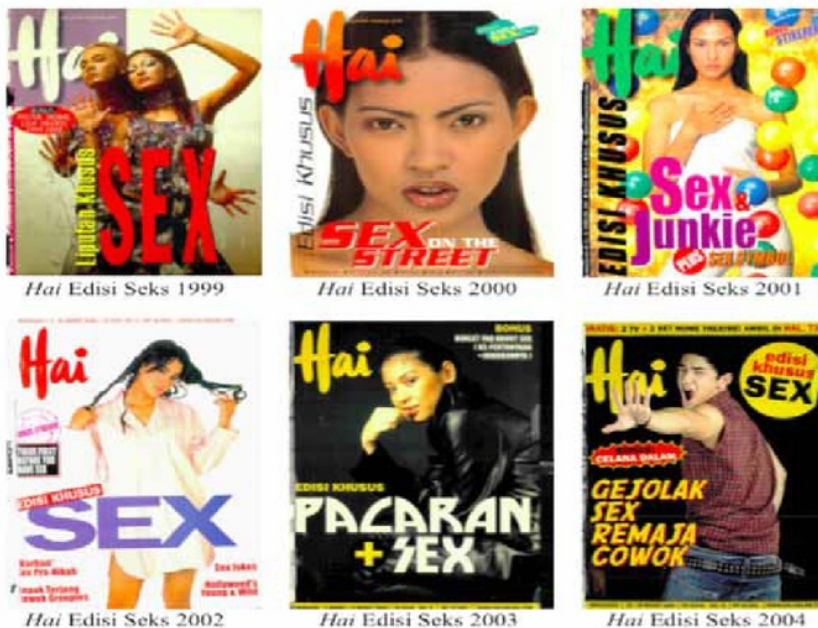
Gambar 4 Sampul Hai Edisi Seks 1999-2004