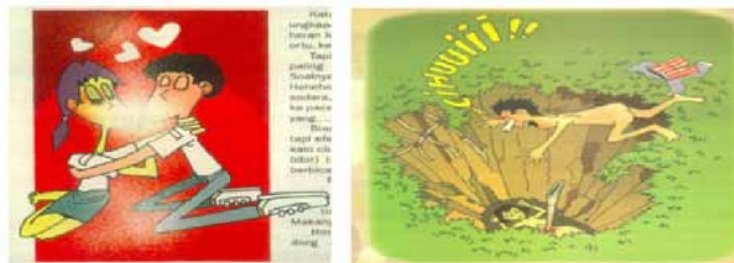
Gambar 8 Gambar remaja berciuman dan laki-laki dan perempuan yang telanjang dalam Hai edisi 5/1/2004 dan 3/9/1999

Untuk itu Hai menyiasatinya lewat ilustrasi kartun yang menggambarkan orang berciuman atau tubuh telanjang, dengan muatan humor: