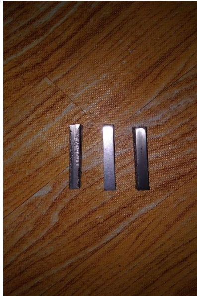
Gambar 3.17 Spesimen yang sudah dipotong