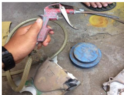
Gambar 3.5 Sprey Gun

Gas Karbondioksida digunakan untuk mengeraskan pasir tembak yang sudah dicampur dengan bahan perekat/minyak polimer. Agar menjadi bagian cetakan yang nantinya akan disatukan menjadi satu cetakan dengan cara menyemprotkan kedalam pasir yang sudah dibentuk agar mengeras membentuk cetakan yang diinginkan.