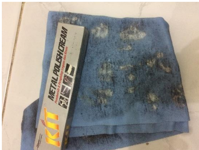
Gambar 3.10 Autosol dan Kain Halus

Digunakan untuk menghilangkan goresan yang timbul pada permukaan spesimen uji setelah dilakukan pengamplasan. Untuk selanjutnya dilakukan pengujian.