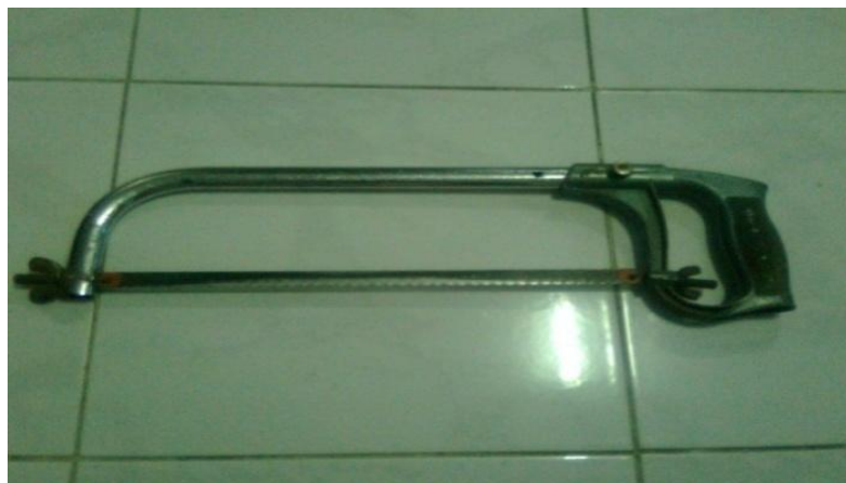
Gambar 3.8 Gergaji Besi

Digunakan untuk memotong spesimen yang akan diuji dengan ukuran yang sesuai standar. Dan untuk memotong Ti-B sesuai ukuran yang diinginkan.