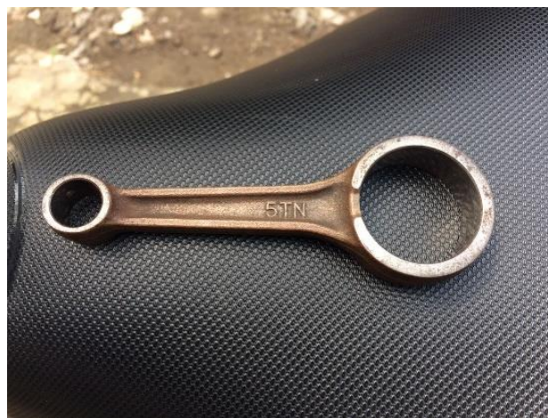
Gambar 3.14 Connecting Rod

Setelah pembuatan cetakan selesai dilanjutkan dengan peleburan piston bekas yang dimasukkan kedalam kowi yang ada pada dapur peleburan. Peleburan menggunakan arang. Untuk memepersingkat waktu peleburan piston, digunakan solar yang dipadukan dengan solar untuk mempercepat