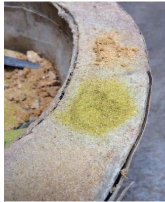
Gambar 3.3 Pasir Silika

banyak volume satuan kristal dan juga adanya biasan cahaya dari kristal tersebut.