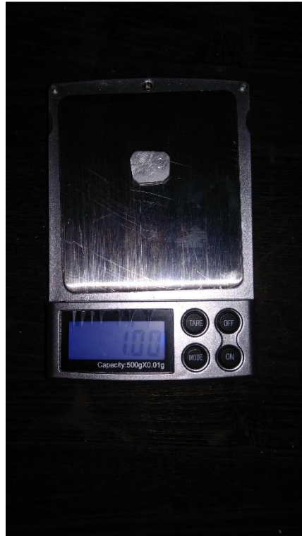
Gambar 3.7 Timbangan Digital ketelitian 0,5 gram