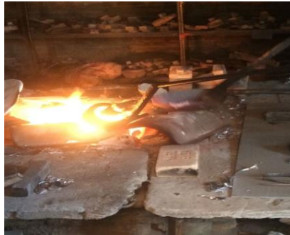
Gambar 3.6 Dapur Peleburan