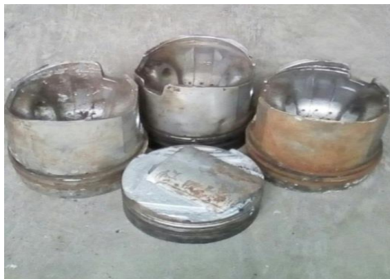
Gambar 3.2 Bahan Pengecoran Piston Bekas

Aluminium yang dipakai untuk bahan dasar pembuatan connecting rod berasal dari bekas piston mobil diesel.