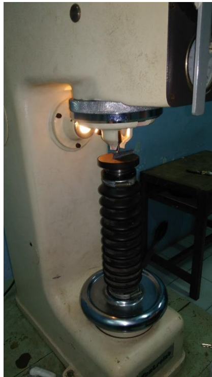
Gambar 3.11 Alat Kekerasan Makro Vickers ( Macro Vickers Hardness Tester )

Untuk mengetahui seberapa besar nilai kekerasan spesime yang dibuat dengan menentukan panjang diagonal 1 dan diagonal 2 dan diambil rata-rata dilanjutkan dengan memasukan angka rata-rata tersebut kedalam rumus. Sehingga diketahui nilai kekerasan yang dimiliki spesimen tersebut.