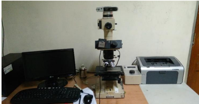
Gambar 3.12 Mikroskop Optik ( Metallurgical Microscope Invertgo Tipe )