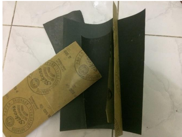
Gambar 3.9 Amplas 400, 800, 1000, 2000, 5000

Digunakan untuk menghaluskan dan meratakan permukaan spesimen sehingga siap untuk diuji yang akan menghasilkan pengujian yang maksimal. Amplas yang digunakan yaitu nomor 400 sampai dengan 5000.