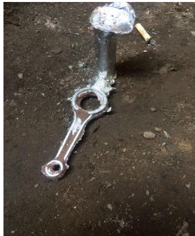
Gambar 3.15 Hasil Pengecoran Connecting Rod

peleburan tersebut, sehingga piston dapat mencapai titik lebur yang maksimal. Setelah piston dalam kowi tersebut mencair total baru dimasukan Ti-B sebesar 0,05% dan diaduk sampai rata. Sekiranya Ti-B sudah merata yang selanjutnya penuangan pada cetakan. Tunggu beberapa detik hingga piston mengeras dan dapat dibongkar dari cetakan.