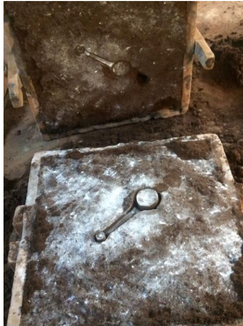
Gambar 3. 13 Cetakan Connecting Rod