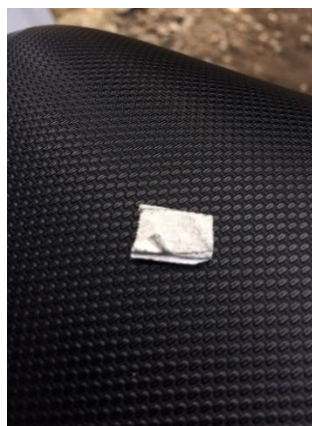
Gambar 3.4 Titanium Boron (Ti-B)

Tambahan Titanium-Baron (Ti-B) berfungsi sebagai inokulan yaitu sebagai penghalus butir pada hasil peleburan. Titanium-baron (Ti-B) ini memiliki harga yang mahal, akan tetapi penggunaannya untuk campuran peleburan tidak banyak, akan tetapi hanya membutuhkan sedikit saja. Titanium-baron yang digunakan dalam penelitian ini sebesar 1 gram. Dimana 1 gram didapat dari hasil perhitungan jumlah bahan baku dikali 0,05%.