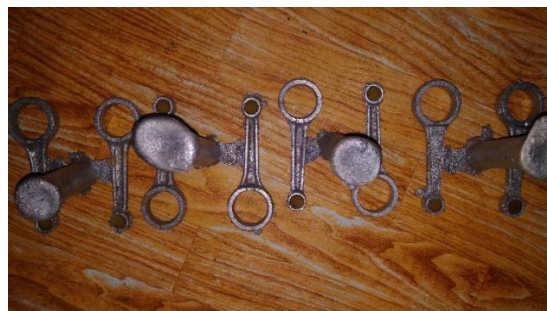
Gambar 3.16 Hasil Pengecoran Spesimen

Pembuatan spesimen sama dengan pembuatan prototipe. Yang membedakan yaitu material dipotong bagian big end dan bagian small end untuk mempermudah saat proses pengujian sepesimen.