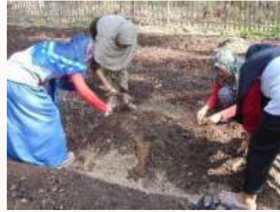
c. Penanaman Sistem Blok d. Penanaman Temu Kunci