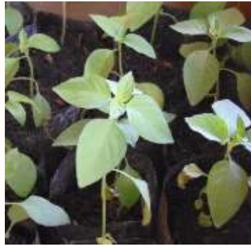
b. Bibit kemangi