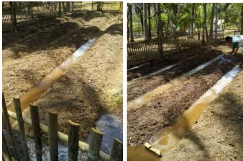
Gambar 5. Penyiraman Bibit dengan Penggenangan Alur antar Bedengan

yaitu air dipompa dari sumur dan dialirkan ke lahan penanaman sehingga semua alur antar bedengan penuh terisi air (Gambar 5).