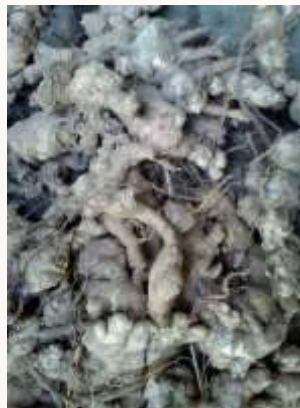
e. Bibit Temu Kunci