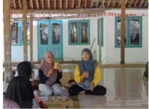
b. Penyuluhan produk dan kegunaan tanaman obat