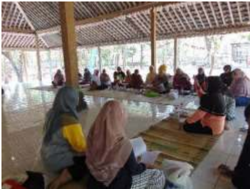
c. Peserta antusias mengikuti penyuluhan