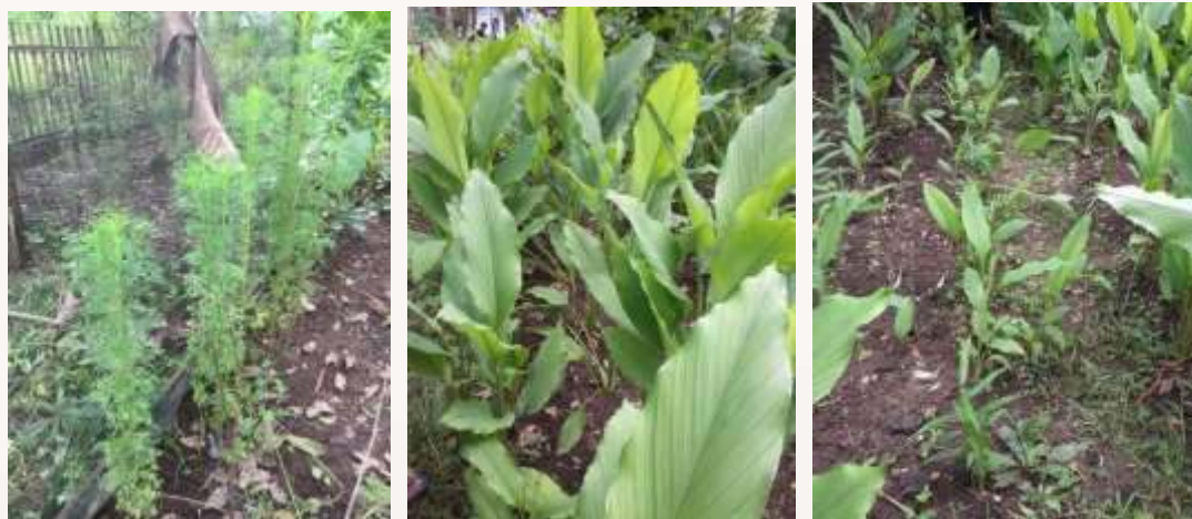
a. Tanaman Adas tumbuh di tepi pagar

Tanaman obat keluarga terutama jenis empon-empon (jahe, kunyit, lengkuas, kunci) memerlukan waktu 6 – 8 bulan untuk siap dipanen. Monitoring pertumbuhan TOGA dilakukan untuk memastikan tanaman tumbuh baik. Berdasar hasil pengamatan, tanaman tumbuh dengan baik sebagaimana terlihat pada gambar 6. Tanaman TOGA tersebut tetap akan dipelihara sampai siap dipanen.