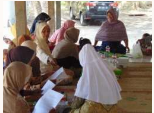
d. Peserta mencermati bahan penyuluhan