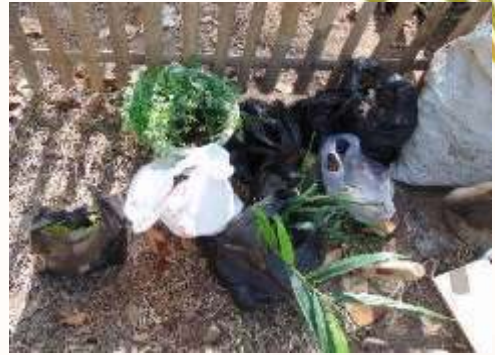
c. Bibit Adas dan Kenikir