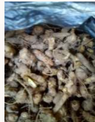
f. Bibit Jahe