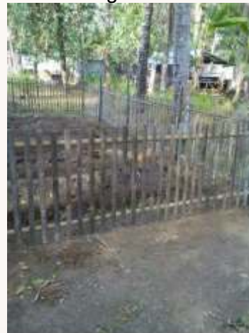
d. Lahan Penanaman TOGA tampak samping