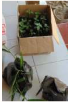
a. Bibit Jahe dan kemangi