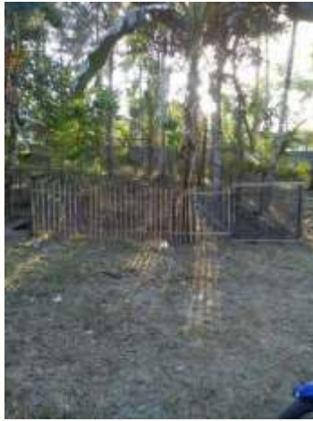
a. Lahan Penanaman TOGA tampak depan