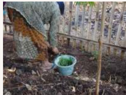
g. Penanaman Bibit Adas h. Penanaman Bibit Kenikir