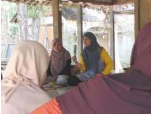
a. Penyuluhan jenis dan budidaya tanaman obat