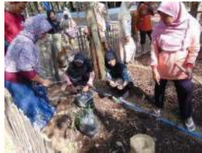
a. Pembuatan Lubang Tanam b. Penanaman Bibit Jahe