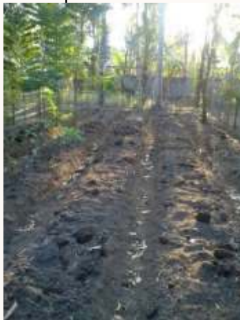
c. Bedengan untuk Penanaman TOGA