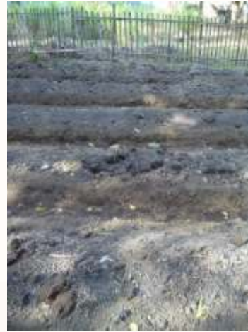
b. Pupuk Kandang ditaburkan di Bedengan