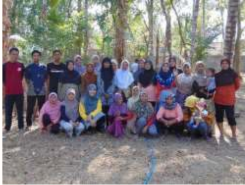
Gambar 7. Anggota KWT Pendopo dan Sekarwangi di depan area penanaman