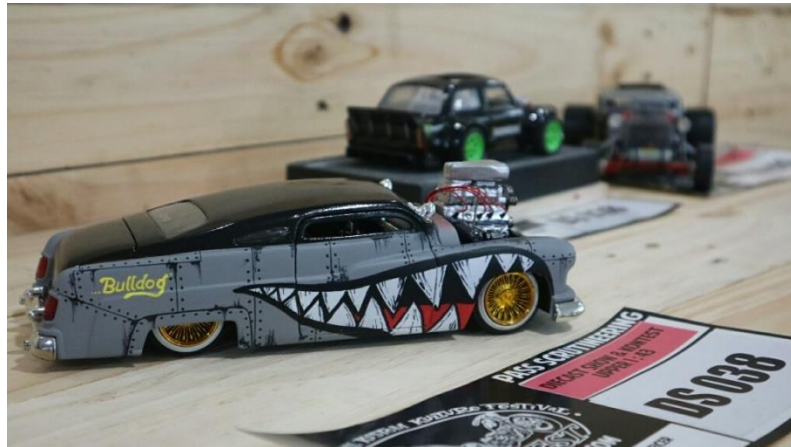
Gambar 2.11. Die Cast Show & Kontes

( http://kustomfest.com/programs/die-cast-show-kontes/ , diakses pada 6 Maret 2018).