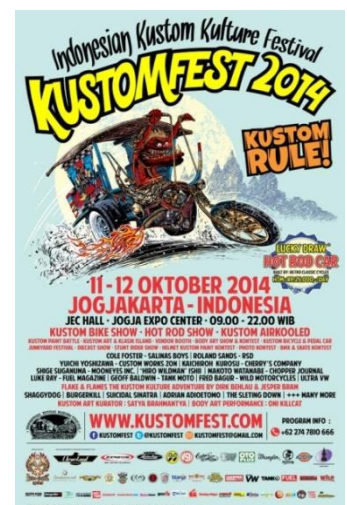
Gambar 2.3. KUSTOMFEST 2014 (tahun ke-3)