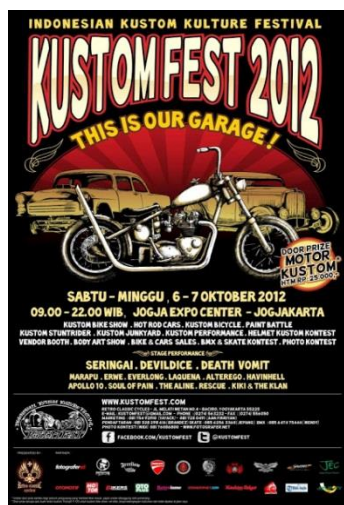
Gambar 2.1. KUSTOMFEST 2012 (tahun pertama)

Untuk event KUSTOMFEST itu sendiri berdiri sejak tahun 2012 yakni pada bulan Oktober dengan mengosong tema yang berbeda pada tahun-tahun berikutnya. Pada tahun pertama KUSTOMFEST mengangkat tema “ This Is Our Garage ”, tahun ke-2 2013 mengangkat tema “ Kustom What? ”, tahun ke-3 2014 mengangkat tema “ Kustom Rule ”, tahun ke-4 2015 mengangkat tema “ Showin’ Soul ”, tahun ke-5 2016 mengangkat tema “ Reborn Legend ” dan terakhir yakni pada tahun yang akan dibahas penelitian ini yaitu tahun ke-6 2017 yang mengangkat tema “ No Boundaries ”(hasil wawancara denga Aan Fikriyan selaku Wakil Direktur CV. Retro Classic Cycle pada 5 Maret 2018).