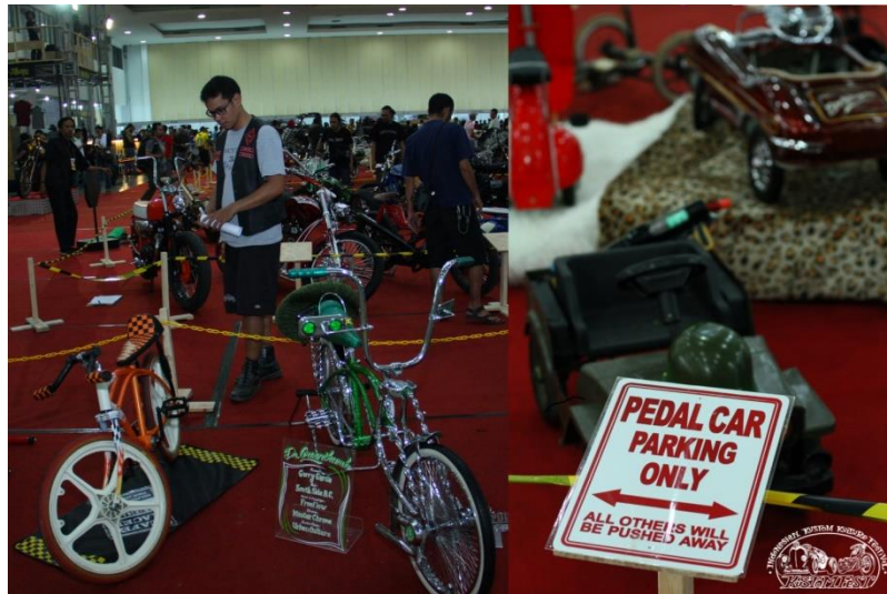
Gambar 2.9. Kustom Bicycle & Pedal Car

Selain kompetisi official KUSTOMFEST 2017 peserta yang tidak terseleksi untuk mengikuti kompetisi diberikan kesempatan secara gratis untuk memajang hasil karyanya pada area Display & Show Kustom. Hal tersebut dilakukan sebagai wujud apresiasi kepada para designer dan engineer yang telah memberikan kontribusinya pada event KUSTOMFEST 2017.