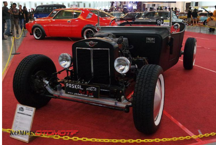
Gambar 2.8. Pickup Paradise dalam kategori Hot Rod Cars

Merupakan show & eksibisi khusus mobil Hot rod, Low Rider, Pickup, Muscle Car, Airkooled, Japan Retro Car dengan berbagai jenis kendaraan seperti Truck, sedan, Van, Limo , dan seluruh tipe Volkswagen dan Airkooled . Nantinya KUSTOMFEST akan memilih Best Hot Rod, Best Low Rider, Best Musscle Car, Best Airkooled, Best Japan Retro Car, Best Pickup dan juga People Choice Kustom Car (favorite pengunjung) .