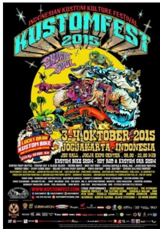
Gambar 2.4. KUSTOMFEST 2015 (tahun ke-4)