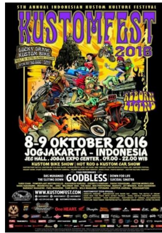
Gambar 2.5. KUSTOMFEST 2016 (tahun ke-5)