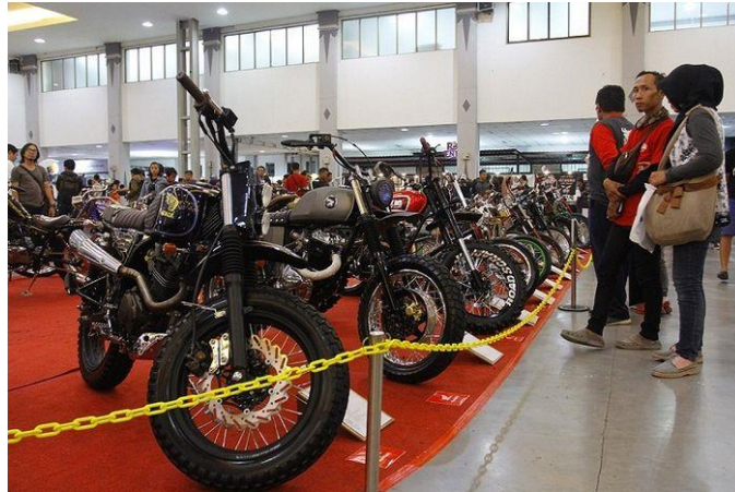
Gambar 2.7 Kustom Bike Show KUSTOMFEST 2017

Yang menjadi ketentuan dalam kompetisi ini adalah sepeda motor yang dapat digunakan, dengan jenis materi yakni sepeda motor jenis strike maupun sidecar . Adapun unsur kreatif yang nantinya akan menjadi tolak ukur penilaian unsur kreatif yakni state-of-the-art dan juga fungsi. Penempatan dalam menambahkan aksesoris juga nantinya akan menjadi faktor penilaian. Kompetisi ini nantinya akan terbagi menjadi dua jenis kelas yakni: