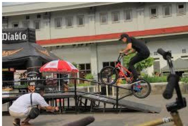
Gambar 2.12. BMX Kontes

BMX Kontes merupakan kompetisi adu ketangkasan sepeda berjenis BMX dengan pengelompokan berdasarkan 4 kategori dan kelas yang diantaranya open street , open flatland , dan best trick ( http://kustomfest.com/programs/bmx-skate-kontes/ , diakases pada 6 Maret 2018).