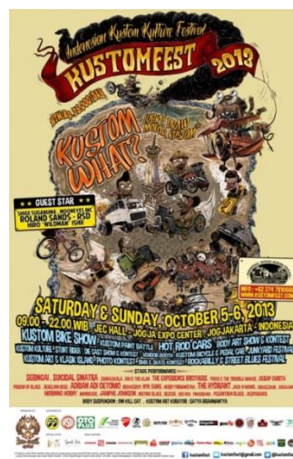
Gambar 2.2. KUSTOMFEST 2013 (tahun ke-2)