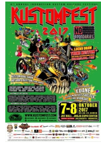
Gambar 2.6 KUSTOMFEST 2017 (tahun ke-6)

Tahun 2017 merupakan tahun ke-6 pelaksanaan event KUSTOMFEST yang diselenggarakan oleh CV. Retro Classic Cycle. Pada tahun tersebut KUSTOMFEST mengangkat tema “ No Boundaries ” dengan filosofi sebuah kebebasan dalam berkarya. KUSTOMFEST ingin mengajak para designer dan engineer berkarya tanpa adanya sebuah batasan apapun dengan menghasilkan berbagai macam karya yang innovative . Dengan adanya berbagai hasil karya tersebut sekaligus menjadi sarana dalam mengekspresikan keberagaman budaya yang ada di Indonesia. Tujuan dilaksanakannya kegiatan ini adalah untuk mempersatukan para designer dan engineer dunia kustom otomotif serta menjadi wadah bagi mereka untuk memperlihatkan hasil karyanya.