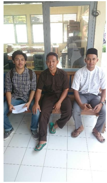
(Masyarakat Kecamatan Sanden)