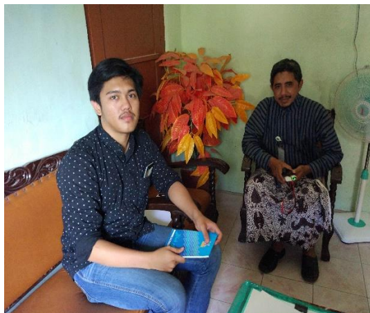
(Sekretaris Kec. Sanden)