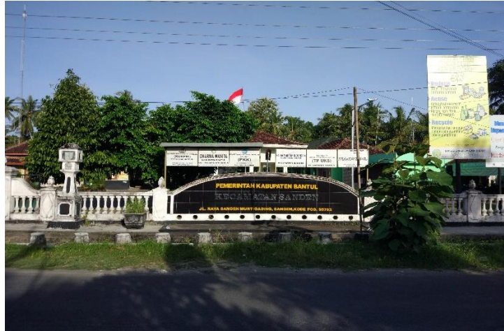
(Kantor Kecamatan Sanden)