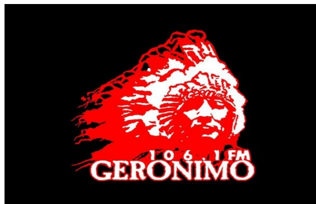
Gambar 1.1 Logo Radio Geronimo.

Dengan memilih logo tersebut, Radio Geronimo berharap bisa meneladani sejarah kepala suku tersebut yang memiliki kekuatan dalam merintis kehidupan mulai dari bawah dengan segala kekurangannya hingga menjadi yang terkuat. Selain logo,