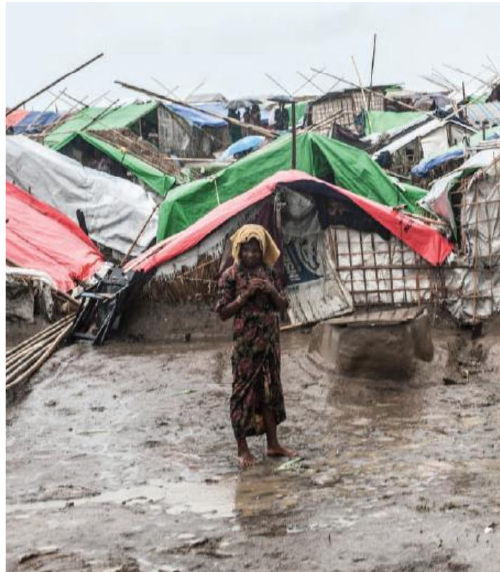
Gambar 3 : Kamp-kamp pengungsian yang dihuni warga Rohingya

pada Holocaust Yahudi maupun Bosnia. Huruf (b) tentang kerusakan mental atau fisik secara serius ditunjukkan dengan pertumpahan darah kelompok korban. Lebih lanjut, kondisi yang tidak manusiawi di kamp-kamp pengungsian terbatas yang dihuni 140.000 orang Rohingya dapat memenuhi huruf (c) yang secara disengaja membawa kondisi kehidupan korban dapat diperhitungkan menuju kehancuran fisik secara keseluruhan atau sebagian. Hal tersebut dapat dilihat dari gambar berikut, di mana seorang wanita Rohingya sendirian berdiri di tengah hujan di sebuah kamp yang jorok untuk pengungsi di Negara Bagian Rakhine pada tahun 2015. Selama hujan lebat dari Agustus hingga Oktober, ketinggian air naik tingkat air naik di dalam kamp.