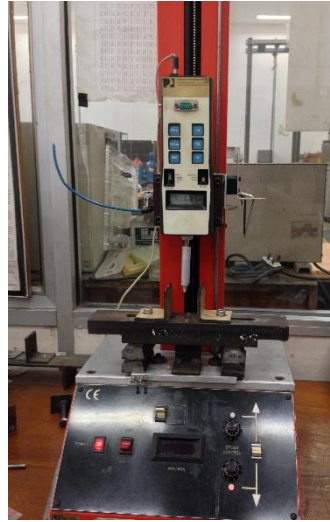
Gambar 4. Universal Testing Machine

berbeda. Alat yang digunakan untuk menguji kekuatan tekan tersebut adalah Universal Testing Machine . Plat resin diuji satu demi satu, plat diletakkan pada tempat yang disediakan lalu ditekan dengan menggunakan indentor hingga plat akrilik pecah.