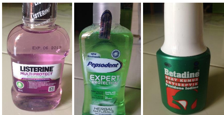
Gambar 2. Obat kumur yang digunakan

selama 7 hari dan perendaman tersebut tiap harinya akan dilakukan selama 2 menit pada sore hari pukul 15.30. Setiap hari selama dilakukan perendaman, obat kumur dan saliva buatan diganti dengan yang baru. Setelah dilakukan perendaman dengan obat kumur, plat akrilik akan direndam dalam saliva buatan hingga waktu perendaman obat kumur selanjutnya dilakukan.