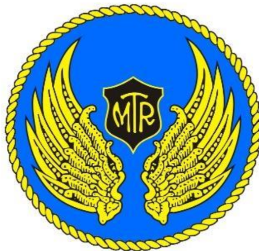
Gambar 4.1 Logo BMT Batik Mataram