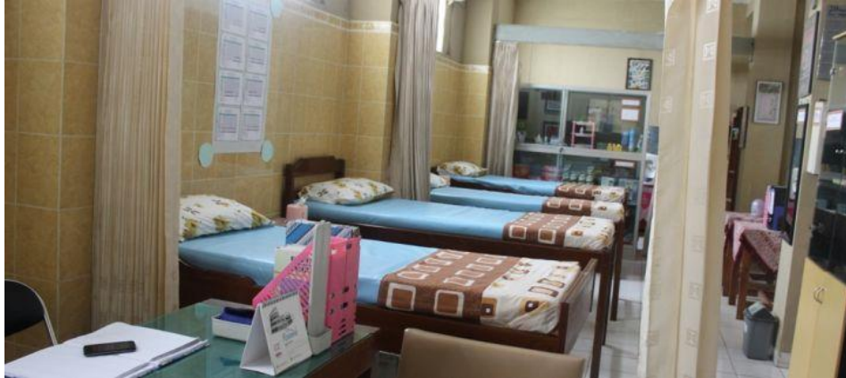
Gambar 3. Ruangan UKS SMP Negeri 7 Yogyakarta

Sebuah ruangan dengan 4 kamar tidur, nampak terlihat rapi dan nyaman di ujung sekolah. Deretan rak dengan masing-masing label tertempel rapi menjelaskan jenis obat yang ada di dalam rak. Tabung gas, penimbang badan, pengukur tensi, berbagai macam almari, dan poster mengisi ruangan dan semakin menjelaskan kegunaan ruangan tersebut.