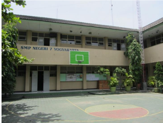
Gambar 2. Foto Bagian Dalam SMP Negeri 7 Yogyakarta

Setelah Indonesia merdeka pada tahun 1945, para pendidik SMP N 3 Yogyakarta yang dikoordinasi BP. R.Ng. Dwijo Martojo mengadakan rapat berulang-ulang untuk memenuhi keinginan rakyat yang ingin sekolah. Langkah pertama yang ingin ditempuh adalah membuka sekolah sore, namun tidak diijinkan oleh Inspeksi SMP DIY, jalan lain yang ditempuh adalah mencari daerah kecamatan yang bersedia mendirikan dan membangun SMP. Hal tersebut disambut positif oleh BP. E.W. Prodjorianto yang menjabat sebagai camat di Tegalrejo pada saat itu. Beliau memerlukan SMP untuk masyarakat yang ingin menyekolahkan rakyatnya. Sebagai realisasinya pada tanggal 2 September 1963 SMP N Tegalrejo filial SMP N 3 Yogyakarta dibuka secara resmi oleh Inspeksi DIY. Dengan mengambil guru dari SMP N 3 Yogyakarta di Pajeksan, kegiatan belajar mengajar berlangsung di rumah