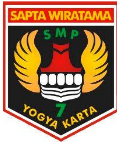
Gambar 1. Logo SMP Negeri 7 Yogyakarta