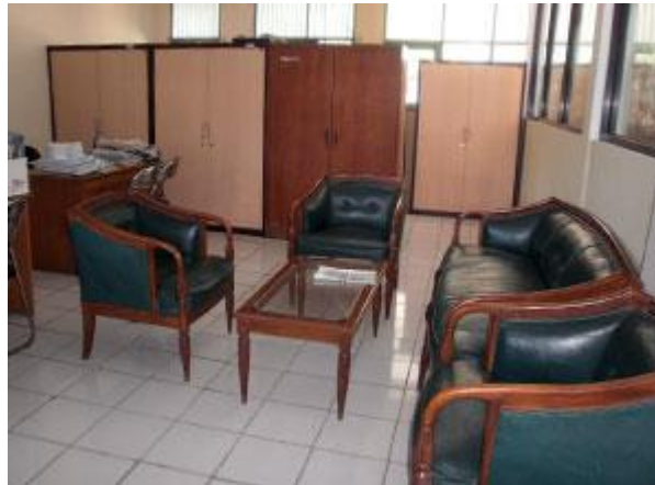
Gambar 4. Ruangan BK SMP Negeri 7 Yogyakarta