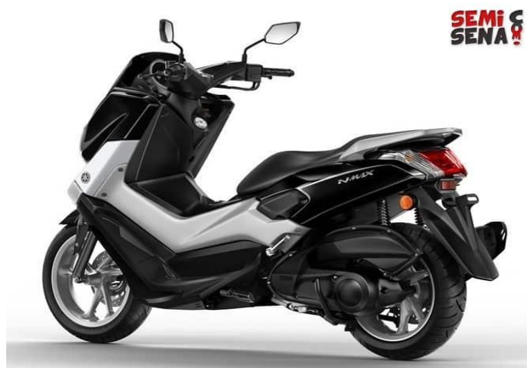
Gambar 2.3 Lampu Belakang Yamaha NMAX

Apalagi pada visor bagian depan yang berukuran besar pada spesifikasi Yamaha NMAX semakin menambah aura full sporty pada skutik premium Yamaha terbaru ini. Sedangkan pada joknya memiliki ukuran yang sangat luas dan empuk akan memberikan kenyamanan berkendara saat berada di atas Yamaha NMAX ini. Didukung dengan pijakan kaki bagian bawah yang dirancang seperti moge semacam HD (Harley Davidson) membuat pengendara sangat betah dan sangat nyaman dalam melakukan perjalanan dengan Yamaha NMAX ini. Bahkan memiliki stang yang sepertinya berjenis Cruiser yang memiliki ketinggian pas semakin membuat nyaman pengendara dalam mengemudikan skutik premium yang besar ini.