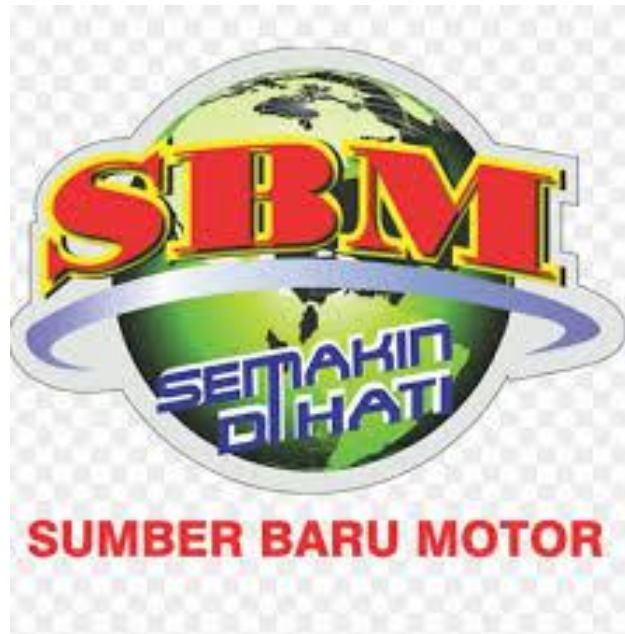
Gambar 2.1. Logo Sumber Baru Motor