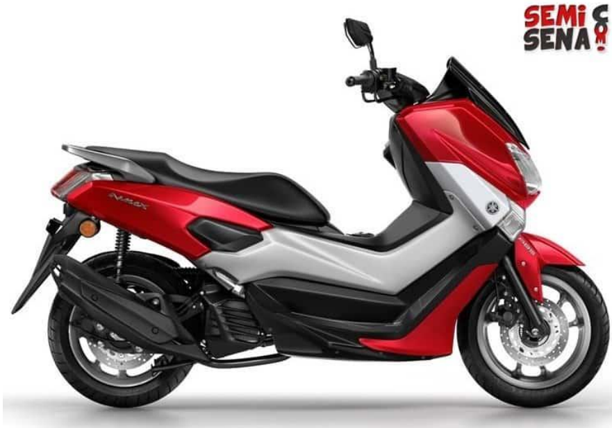
Gambar 2.2. Desain Yamaha NMAX