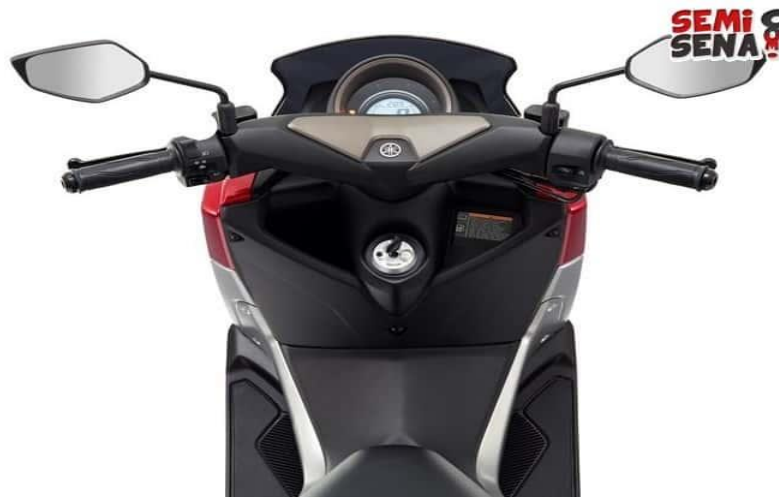
Gambar 2.4. Speedometer Yamaha NMAX