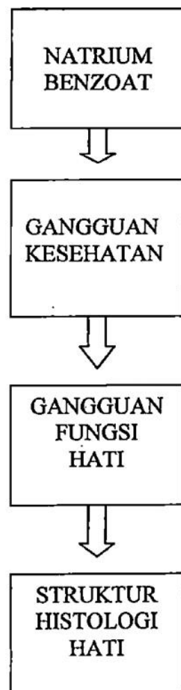
Gambar 2. Skema kerangka konsep efek Natrium benzoat