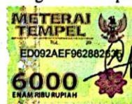
Tanzilal Azizi Rohmah