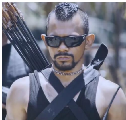
Gambar 4.8 Tokoh Bunian

Bunian adalah anggota dari kelompok Mafia sekaligus tangan kanan dari Panglima Timur. Bunian adalah pembunuh berdarah dingin, ia memiliki kemampuan melacak jejak, beladiri yang baik, dan ahli memanah.