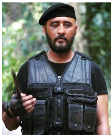
Gambar 4.7 Tokoh Panglima Timur