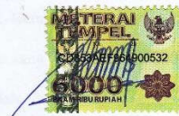
Fajriati Nur Azizah