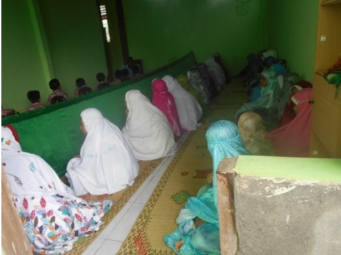
Gambar G. 4.1. Dokumen foto shalat berjamaah