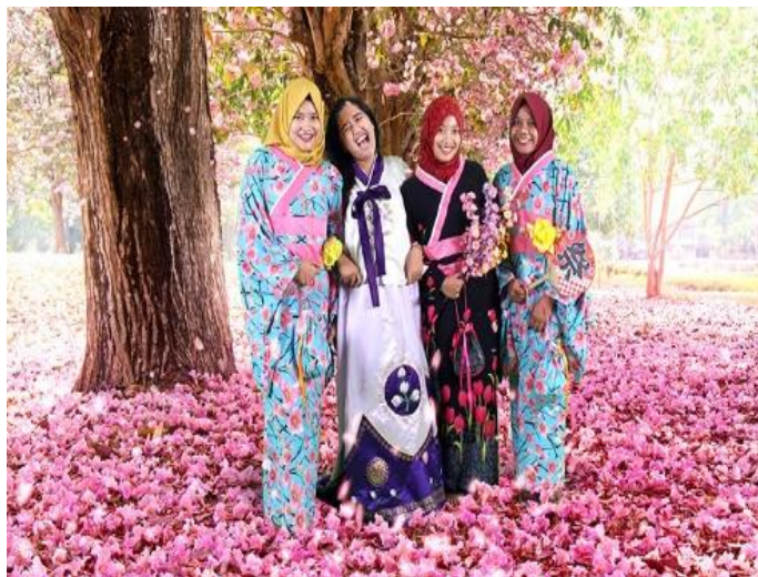
Gambar 1.5. Contoh Lukisan De MATA 2

Demata 2 berisikan 50 gambar 3D, dilengkapi dengan wahana 4D dan Mirror Illusion. Museum ini juga menyediakan Area Photo Studio lengkap dengan teknologi greenscreen untuk para pengunjung yang ingin berfoto dengan kostum Jepang, Belanda, Korea, Mesir, Jawa, dan Cina.