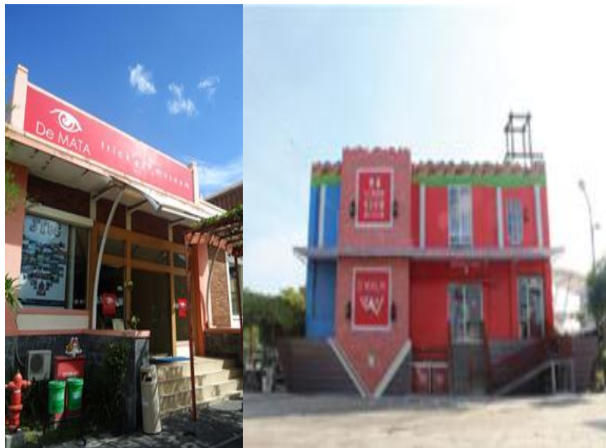
Gambar 1.2. Gedung De Mata Trick Eye Museum

Museum De Mata Trick Eye terletak di Basement XT Square Jl. Veteran, Pandeyan, Yogyakarta (bekas terminal lama Umbulharjo).