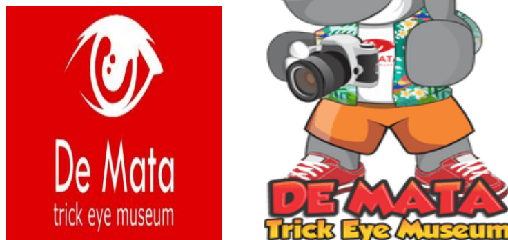
Gambar 1.1. Logo dan Maskot De Mata Trick Eye Museum