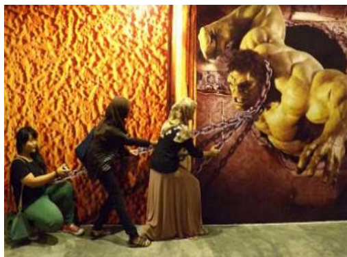
Gambar 1.4. Contoh Lukisan De MATA 1

De MATA 1 adalah wahana wisata 3D pertama dan terbesar di Indonesia yang memiliki koleksi 120 gambar 3D dengan berbagai tema, mulai dari flora, fauna, fantasi, kartun, dan masih banyak lagi. Tidak hanya itu, wahana ini juga dilengkapi dengan teknologi Augmented Reality yang dapat diunduh di playstore. Penggantian gambar berkala setiap tiga bulan dilakukan supaya para pengunjung tidak bosan.