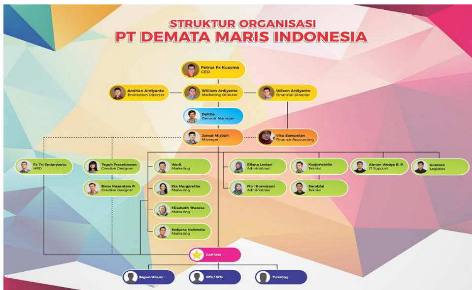
Gambar 1.3. Struktur Organisasi PT. Demata Maris Indonesia