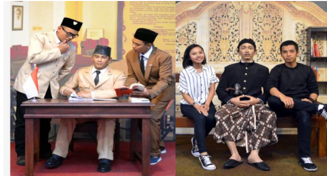
Gambar 1.6. Contoh Patung di De ARCA