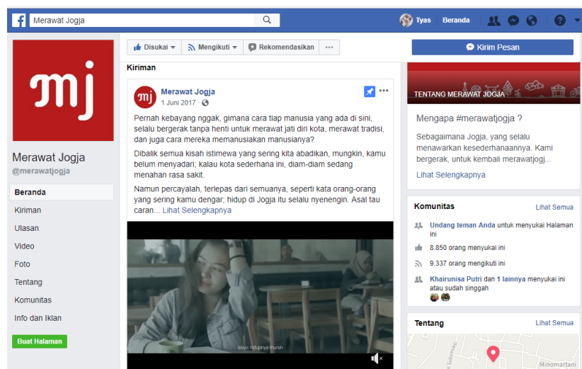
Gambar 2. 3 Tampilan Facebook Merawatjogja

Akun Facebook Merawatjogja memiliki 8.888 aktif followers, 8.441.647 total impressions , 1.945. 616 total reach . Untuk akun Youtube Merawatjogja memiliki 894 active subscribers , 39.630 total views , 94.921 total minutes watch time . Akun Instagram Merawatjogja memiliki 12.267 aktif followers, 1.601.248 total impressions , 856,375 total reach . Twitter 458 aktif followers