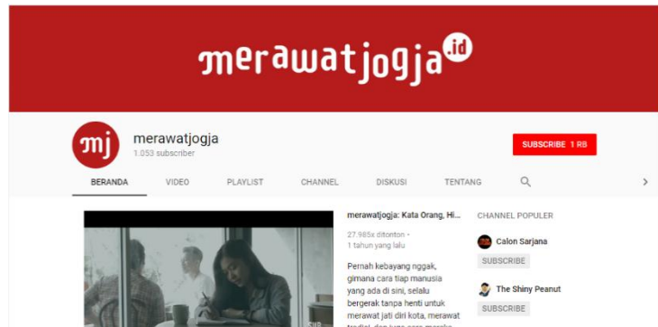
Gambar 2. 4 Tampilan Youtube Merawatjogja