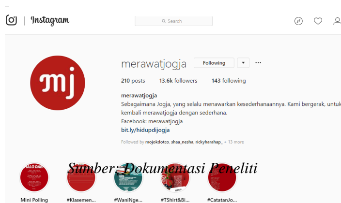
Gambar 2. 6 Tampilan Instagram Merawatjogja