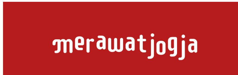
Gambar 2. 1 Logo Merawatjogja