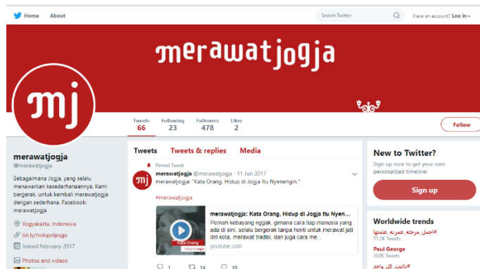
Gambar 2. 5 Tampilan Twitter Merawatjogja