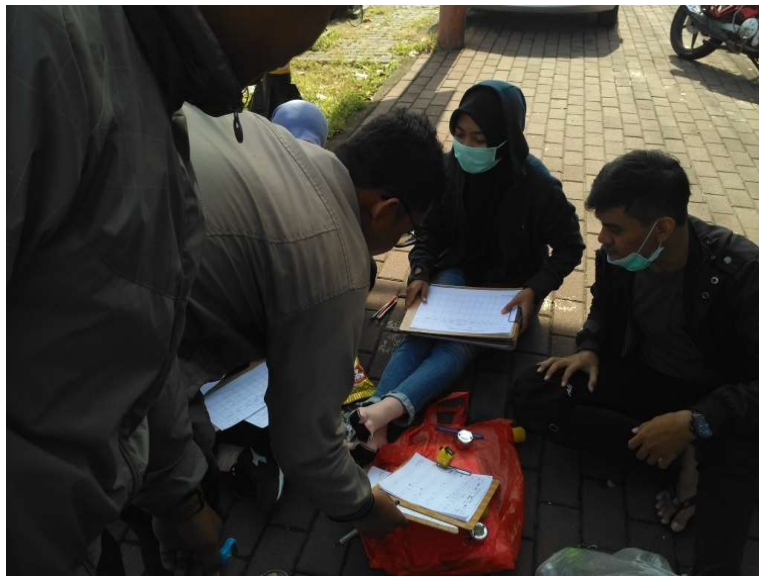
Gambar 6. Survey Lalu Lintas Kelompok 2