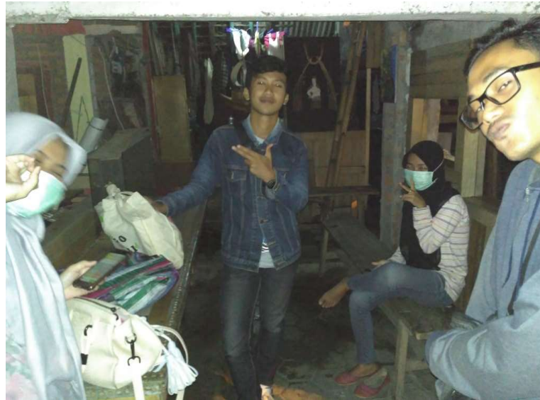
Gambar 7. Survey Lalu Lintas Kelompok 3