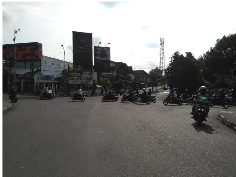
Gambar 4. Ruas Jalan Jlagran Lor