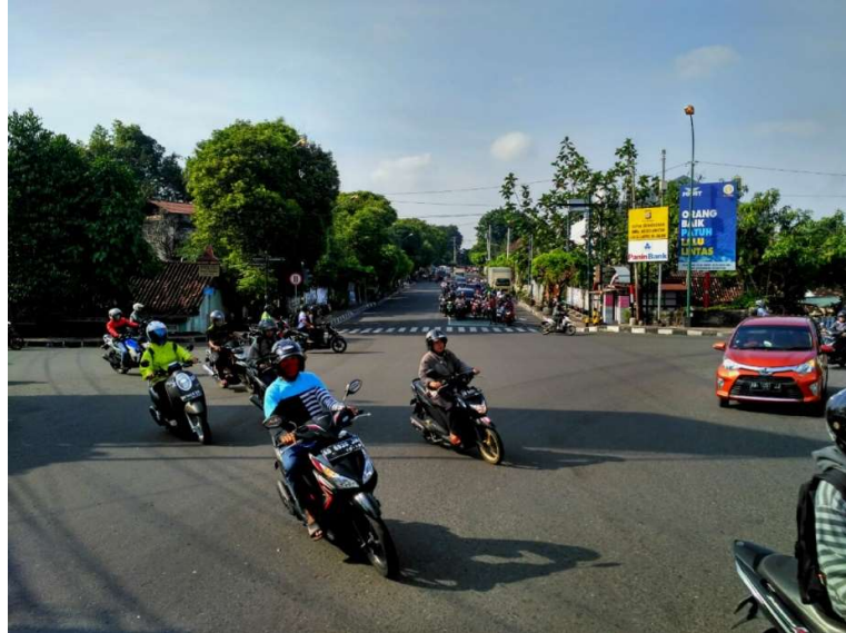
Gambar 1. Ruas Jalan Letjen Suprpto