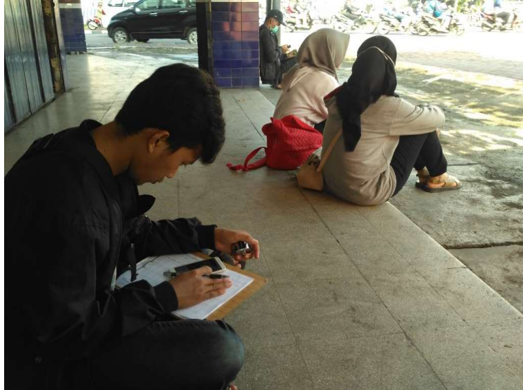
Gambar 5. Survey Lalu Lintas Kelompok 1