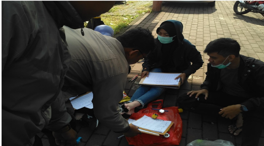
Gambar 6. Survey Lalu Lintas Kelompok 2