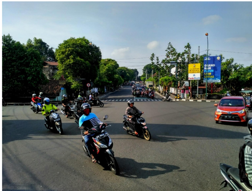
Gambar 1. Ruas Jalan Letjen Suprpto