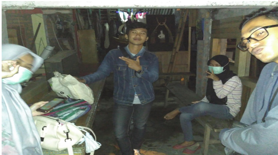
Gambar 7. Survey Lalu Lintas Kelompok 3