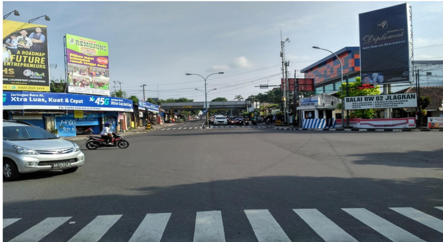
Gambar 3. Ruas Jalan Tentara Pelajar