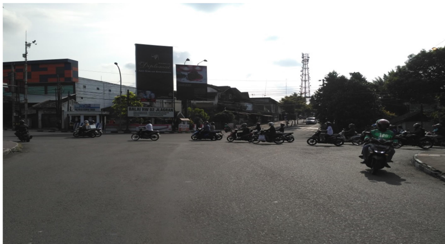
Gambar 4. Ruas Jalan Jlagran Lor