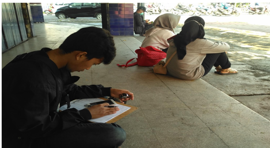
Gambar 5. Survey Lalu Lintas Kelompok 1