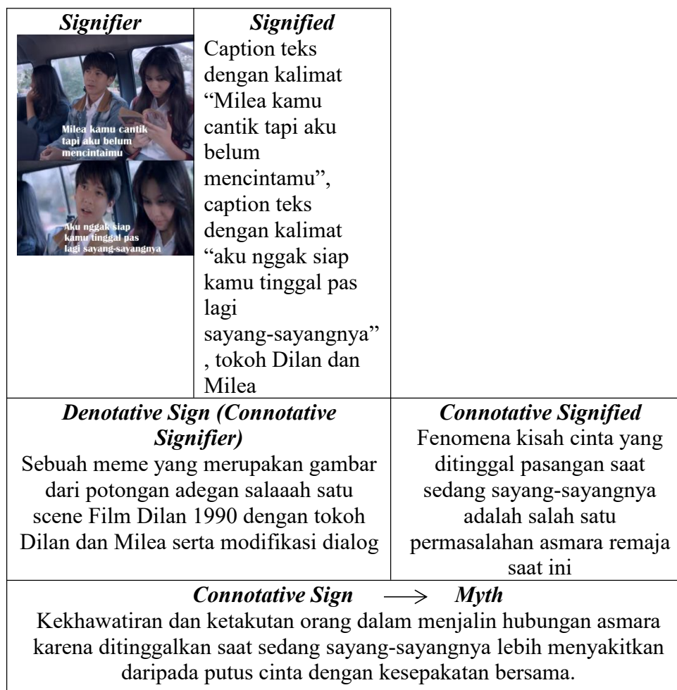
Tabel 1. 10 Analisis Teknik Membangun Humor dalam Meme Dilan Milea