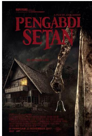
Tabel 1. 1 Data Bentuk Kepopuleran Film dan Meme Pengabdi Setan