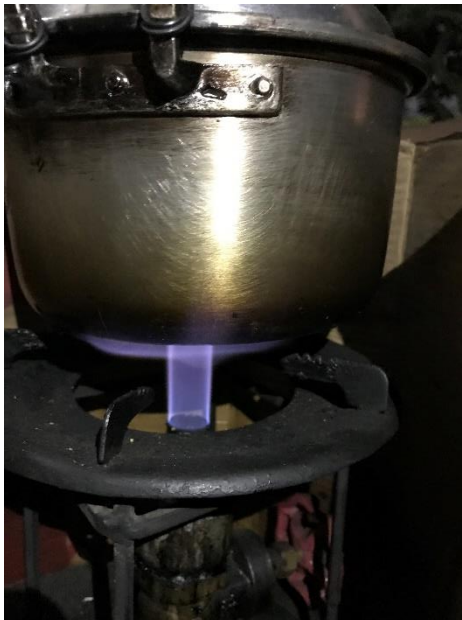
Lampiran 19 Gambar nyala api pada variasi kecepatan udara masuk 1,05 m/s