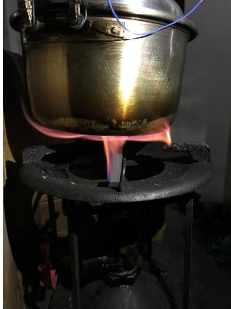
Lampiran 23 Gambar nyala api pada variasi campuran 100% arang kayu