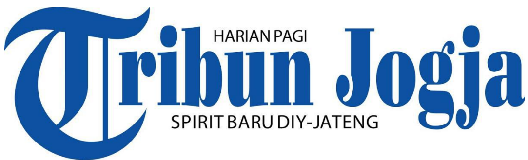
Gambar 2.8 Logo Tribun Jogja