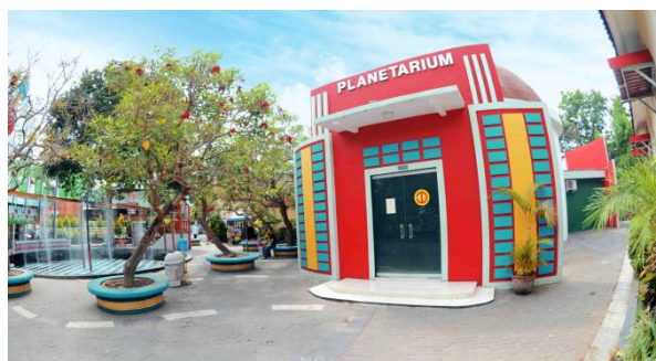
Gambar 2.4 Planetarium

malam hari beserta berbagai macam benda angkasa dan susunan bintang yang tampak pada saat itu. Pertunjukan dilanjutkan dengan pemutaran film tentang perjalanan manusia di Bulan. Semua diproyeksikan pada media kubah berbentuk setengah lingkaran, dilengkapi dengan kursi penonton bersandaran yang bisa direbahkan, sehingga seluruh pertunjukan bisa dinikmati dengan nyaman.