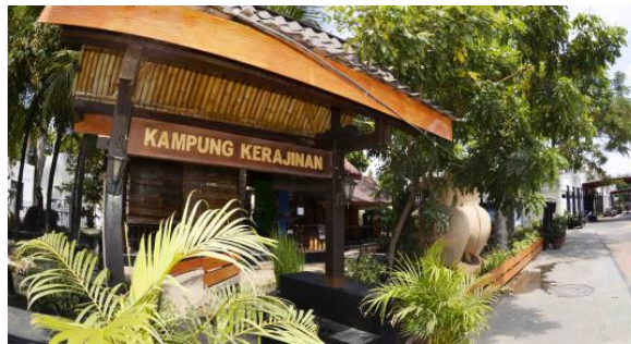
Gambar 2.6 Kampung Kerajinan

Pengembangan program edukasi dan kreatifitas di bidang seni dan budaya yang dapat diikuti oleh semua kalangan usia pengunjung.