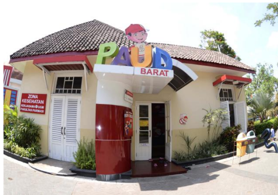
Gambar 2.3 Gedung PAUD

Terdapat 2 gedung PAUD Taman Pintar, PAUD Barat dan PAUD Timur yang menawarkan alat peraga Pendidikan interaktif yang dikhususkan untuk anak-anak usia 2 hingga 7 tahun. Pada zona ini anak-anak akan dikenalkan pada pengetahuan sains dan teknologi tanpa meninggalkan konsep bermain. Dipandu oleh pemandu yang memahami konsep perkembangan anak usia dini dan komunikatif serta peduli pada anak.