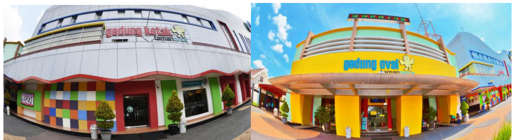
Gambar 2.5 Gedung Oval dan Gedung Kotak

Gedung Oval merupakan zona pembelajaran yang menampilkan imateri sesuai dengan fase kehidupan, mulai dari fase kehidupan air, kehidupan purba, sampai dengan fase peradaban. Sedangkan untuk Gedung Kotak, terdapat tiga kluster pembelajaran. Yaitu kluster Jembatan Sains, Kluster Teknologi Populer, dan Kluster Indonesiaku.