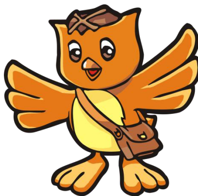
Gambar 2.2 Maskot Taman Pintar Yogyakarta

Selain logo, Taman Pintar mempunyai maskot berupa burung hantu atau dikenal dengan sebutan TEPI. Nama TEPI merupakan akronim dari Taman Pintar selanjutnya dalam kehidupan sehari-hari menjadi Teman Pintar para pelajar. Burung Hantu sebagai lambang ilmu pengetahuan mewakili fungsi Taman Pintar sebagai wahana apresiasi, ekspresi dan kreasi sains bagi para pelajar di Kota Yogyakarta. Tas sebagai salah satu atribut yang identik dengan pelajar.