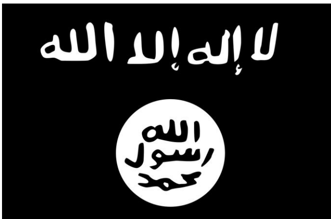
Gambar 1.2 Simbol ISIS