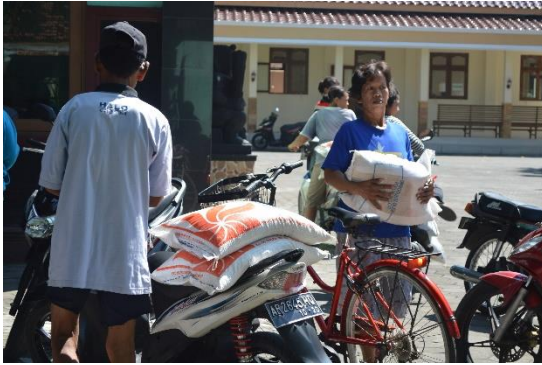
Pembagian subsidi Rastra di desa Tamantirto Tahun 2017