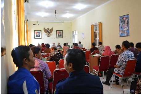
Rapat evaluasi program Rastra di Dinas Sosail P3A, Mei 2017