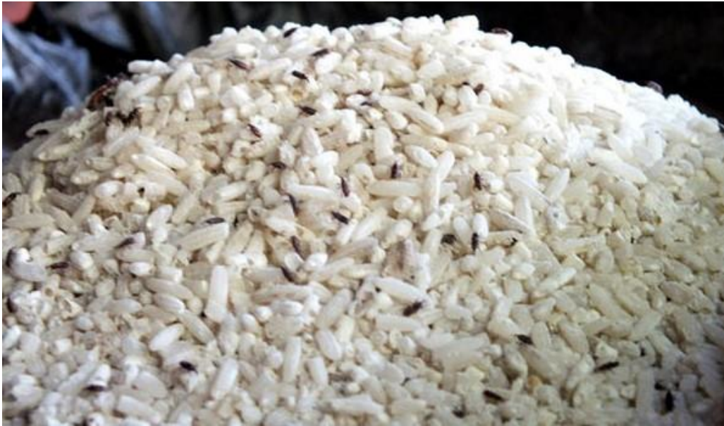
Beras yang diterima saat pendistribusian Rastra di salah satu desa di kecamatan Imogiri tahun 2016