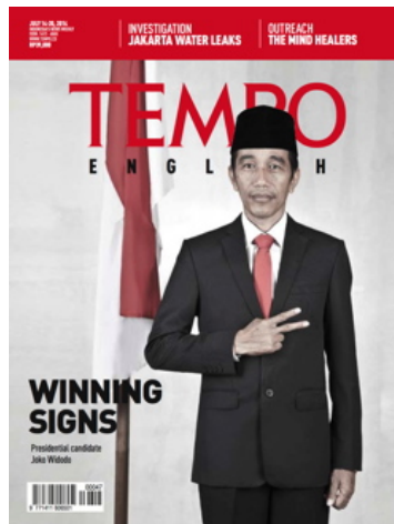
Gambar 2. 3 Contoh Produk TEBI /Tempo English

Saat ini TEBI, yang diterbitkan untuk mengisi bacaan para ekspatriat dan pasar global, semakin solid. Komposisi isinya untuk bagian terbesar memang masih berasal dari majalah Tempo. Selebihnya digarap langsung oleh reporter dan koresponden TEBI. Kerja sama dengan penulis tak tetap dari dalam dan luar negeri juga tetap dijaga.