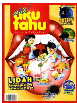
Gambar 2. 6 Contoh Produk Tempo Aha!