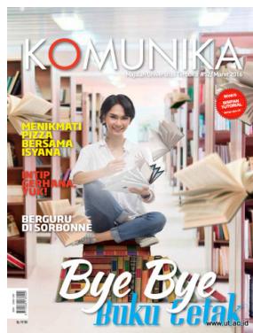
Gambar 2. 5 Contoh Produk Tempo Komunika