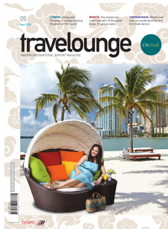
Gambar 2. 4 Contoh Produk Tempo Travelonge

Lahirnya majalah ini tak lepas dari peran berbagai pihak. Semula, Cabang Utama PT Angkasa Pura II, Bandar Udara Soekarno- Hatta, Cengkareng, menerbitkan majalah On Time sebagai layanan informasi seputar bandara kepada para calon penumpang.