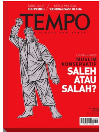
Gambar 2. 1 Contoh Produk Majalah Tempo

Sejak terbit kembali 13 tahun lalu, majalah Tempo konsisten mengusung jurnalisme investigasi alias menyajikan kabar di balik berita dengan mengintip dan membongkar apa yang selama ini disembunyikan dari mata publik.