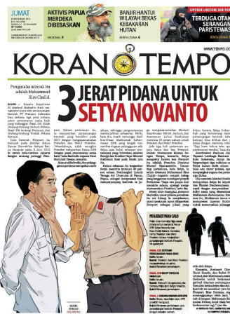
Gambar 2. 2 Contoh Produk Koran Tempo

Sudah satu dekade ini Koran Tempo hadir di hadapan pembaca. Sejak terbit pertama kali pada 2 April 2001, banyak hal telah diungkap untuk memenuhi tuntutan pembaca akan berita yang lebih cerdas dan berkualitas. Ditengah persaingan media sejenis yang semakin ketat koran Tempo tetap terus menyajikan berita yang berbau politik dan ekonomi.