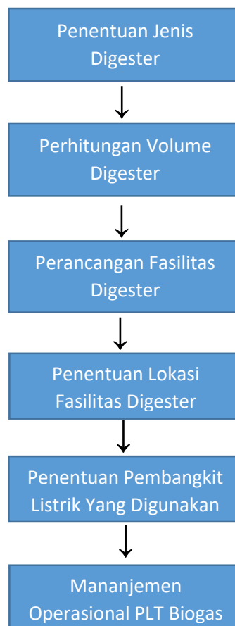
Gambar 3.3 Flowchrat pemilihan dan perhitungan model digester

Dalam penentuan pemilihan digester PLT Biogas ada beberapa pertimbangan sebagaimana diterangkan pada bab 2. Selain potensi bahan baku yang ada, hal lain yang perlu diperhatikan adalah temperatur digester yang dirancang, derajat keasaman (PH) bahan baku biogas dan komposisi C/N (rasio karbon dan nitrogen). Sebagai contoh data sampel adalah potensi limbah tahu di kawasan pengrajin tahu Desa Gunung Saren, Trimurti, Srandakan, Bantul, Yogyakarta. secara sederhana urutan pemilihan jenis digester adalah dimulai dengan perhitungan volume digester yang meliputi potensi bahan baku yang ada dalam menghasilkan gas metan, penentuan model digester, perancangan tangki penyimpanan dan diakhiri penentuan lokasi. Langkah – langkah tersebut secara sederhana seperti gambar berikut ini.