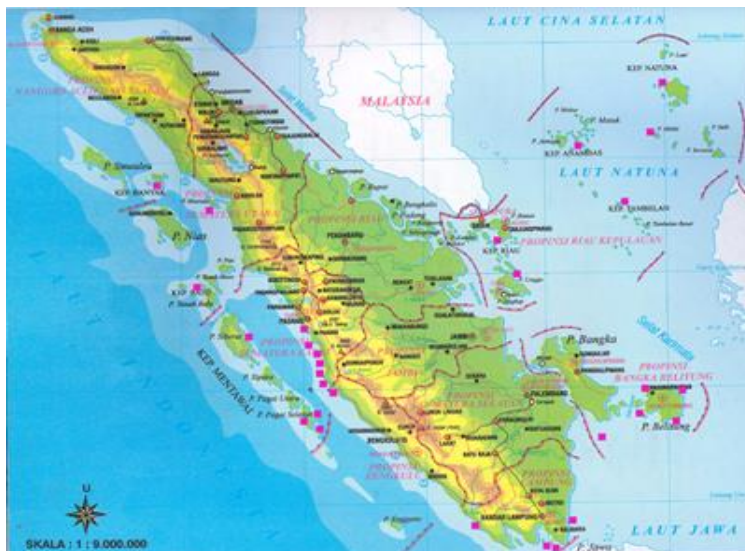
Gambar 2.1. Peta Pulau Sumatera

Kelurahan Air Tiris terletak di salah satu pulau terbesar Indonesia, pulau Sumatera. Pulau Sumatera terdiri dari sepuluh provinsi, Aceh, Sumatera Utara, Riau,