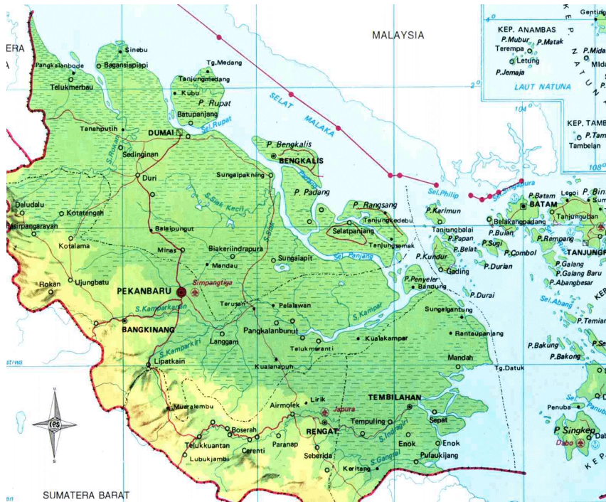
Gambar 2.2. Peta Provinsi Riau