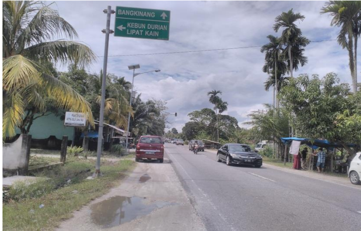
Gambar 2.4. Jl. Pekanbaru – Bukittinggi, lewat Air Tiris