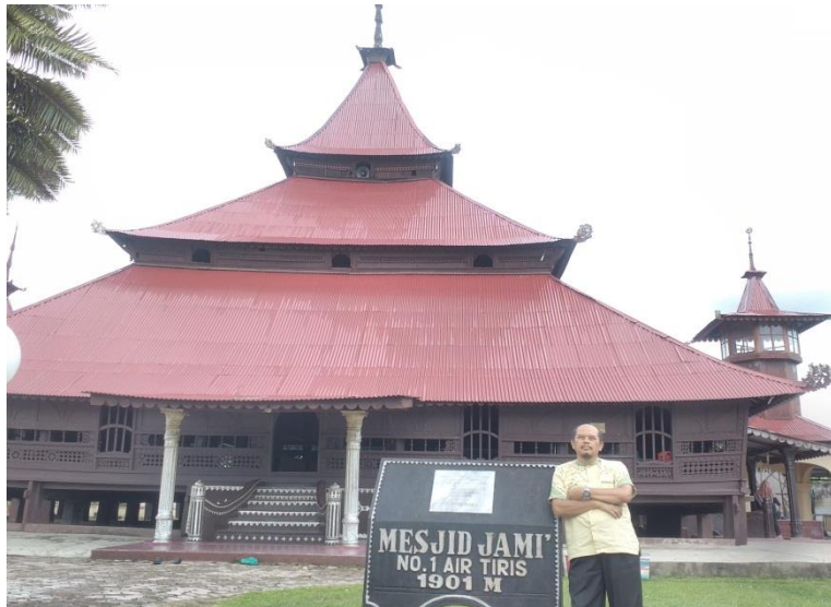
Gambar 2.6. Masjid Jami' Air Tiris