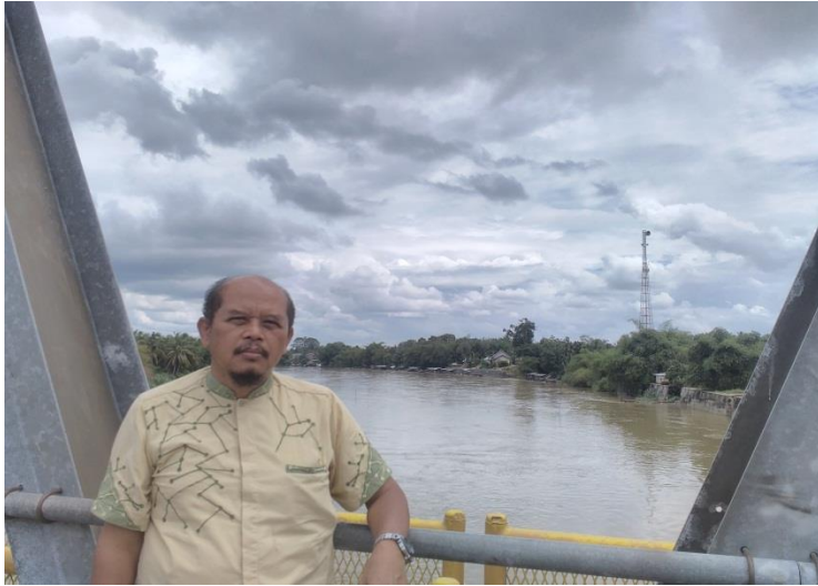
Gambar 2.5. Sungai Kampar Batas Utara Kelurahan Air Tiris