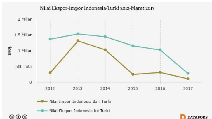
Gambar 3.1 Grafik nilai ekspor-impor Indonesia-Turki tahun 2012 hingga maret 2017

Data dari sumber lain juga menunjukkan bahwa terjadi penurunan dalam neraca perdagangan antara Turki dan Indonesia dari tahun 2012 hingga tahun 2017.