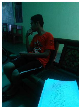
Wawancara dengan mustahiq baitul maal BMT Bina Ihsanul Fikri Yogyakarta