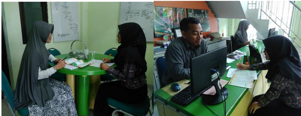
Wawancara dengan karyawan baitul maal BMT Bina Ihsanul Fikri Yogyakarta