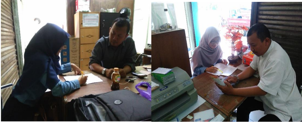
Wawancara dengan manajer baitul maal BMT Bina Ihsanul Fikri Yogyakarta