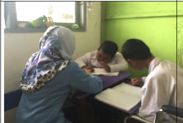
kegiatan belajar mengajar (menulis huruf hijaiyyah)