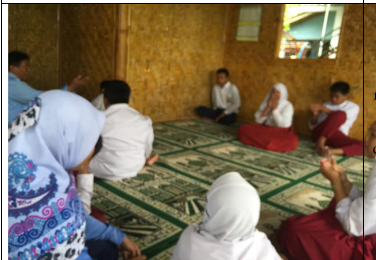
Kegiatan setelah sholat dhuha (zikir setelah sholat, menghafal surat-surat pendek dilanjutkan dengan menghafalkan lagu-lagu daerah dan janji siswa)