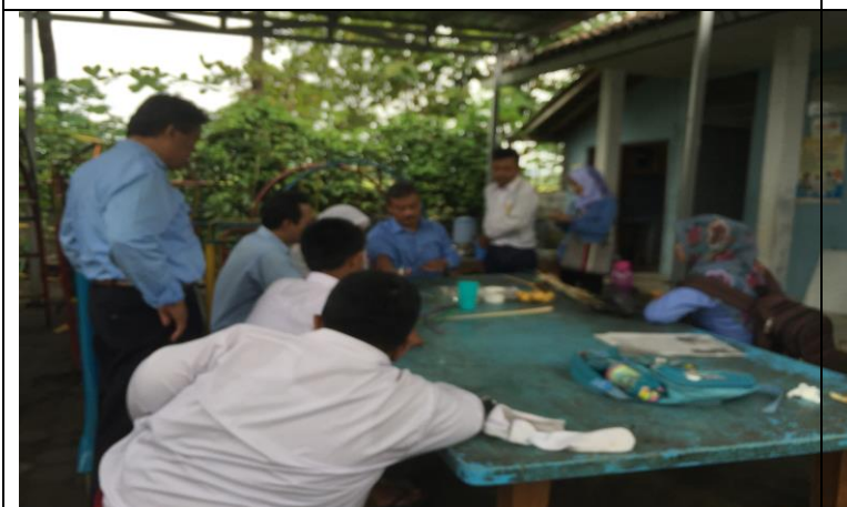
Suasana istirahat diselingi dengan kegiatan kesenian