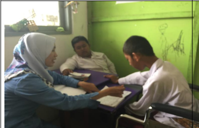
Kegiatan belajar mengajar (membaca huruf hijaiyyah)