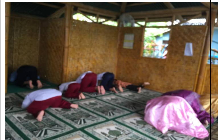
Kegiatan sholat Dhuha