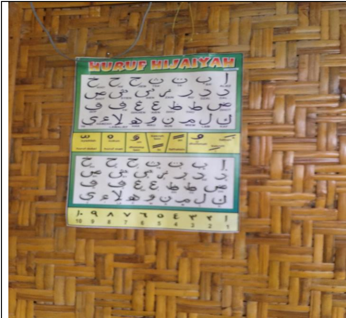
Alat peraga huruf hijaiyyah yang ditempel di musholla sekolah