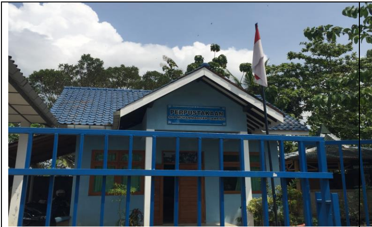
Perpustakaan SLB Muhammadiyah Gamping