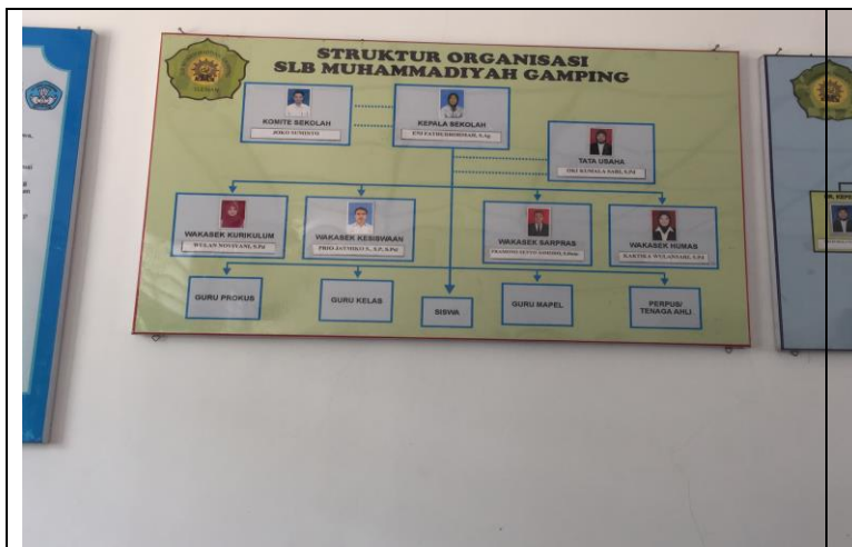
Struktur Organisasi sekolah