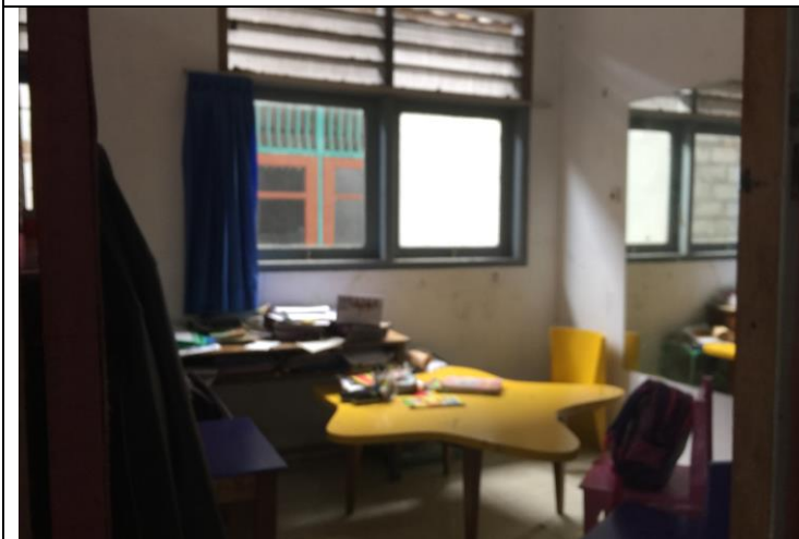
Ruang kelas di SLB Muhammadiyah Gamping