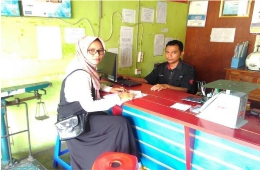
BIF Cabang Bugisan Yogyakarta