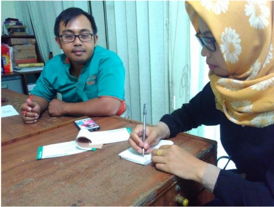
Proses Wawancara Dengan Nasabah Yang Menggunakan Akad Hiwalah di BMT