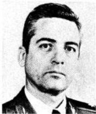
Severo CASAS Regueiro Member of the Cuban Communist Party's Central Committee Major General, First Deputy Minister, Chief of the General Staff.