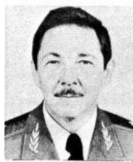
Raul CASTRO Ruz Second Secretary of the Cuban Communist Party's Central Committee General, Minister of the Revolutionary Armed Forces.