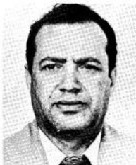
Sergio del VALLE Jimenez Member of the Cuban Communist Party's Politburo Major General, Minister of the Interior.