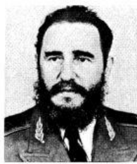
Fidel CASTRO Ruz First Secretary of the Cuban Communist Party's Central Committee General of the Army, Commander in Chief.