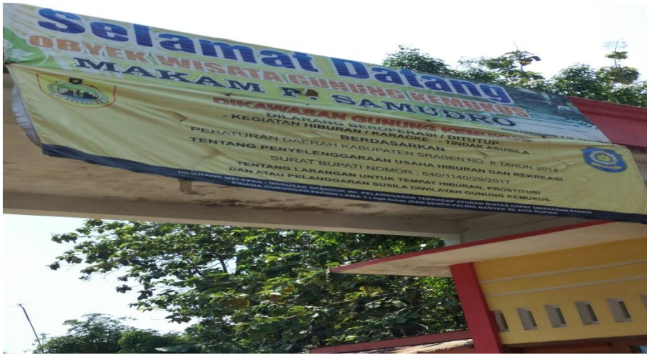
Pintu Gerbang Objek Wisata Gunung Kemukus