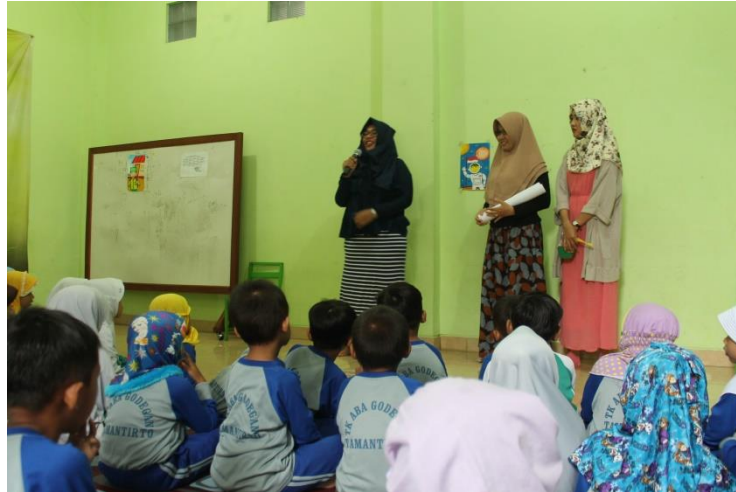
Penjelasan penelitian kepada subyek penelitian