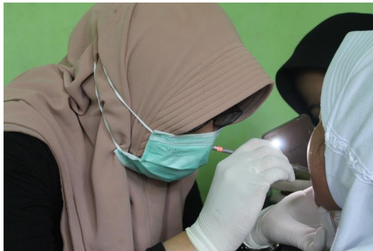
Pemeriksaan indeks karies