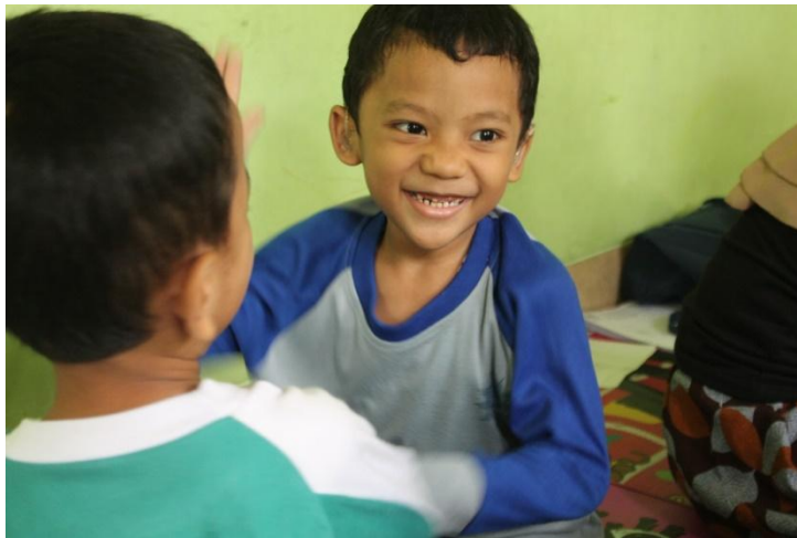
Kondisi gigi siswa TK ABA Godegan Tamantirto