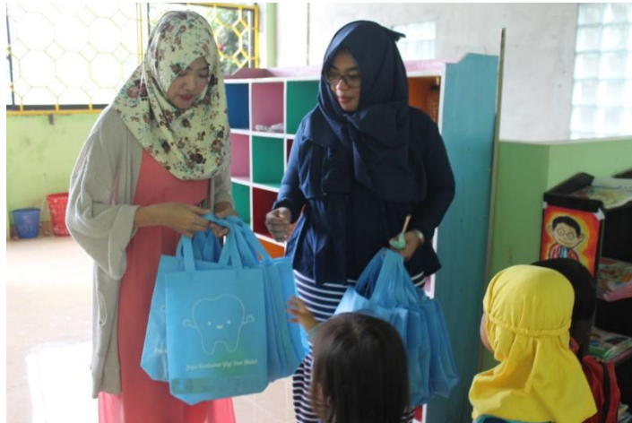
Pembagian bingkisan kepada siswa-siswi TK ABA Godegan Tamantirto