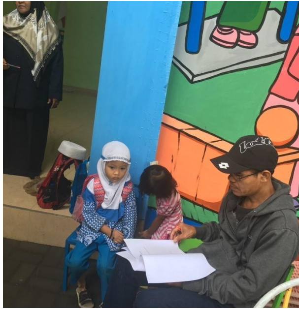
Orangtua siswa-siswi TK ABA Godegan sedang mengisi Identitas responden