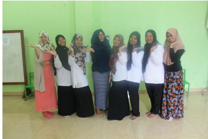
Bersama dengan ibu kepala sekolah dan guru-guru TK ABA Godegan Tamantirto