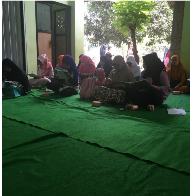
Orangtua siswa-siswi TK ABA Godegan sedang mengisi Identitas responden