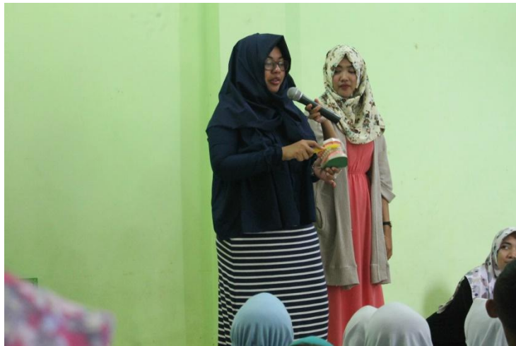
Penyuluhan tentang cara menggosok gigi yang benar di TK ABA Godegan Tamantirto