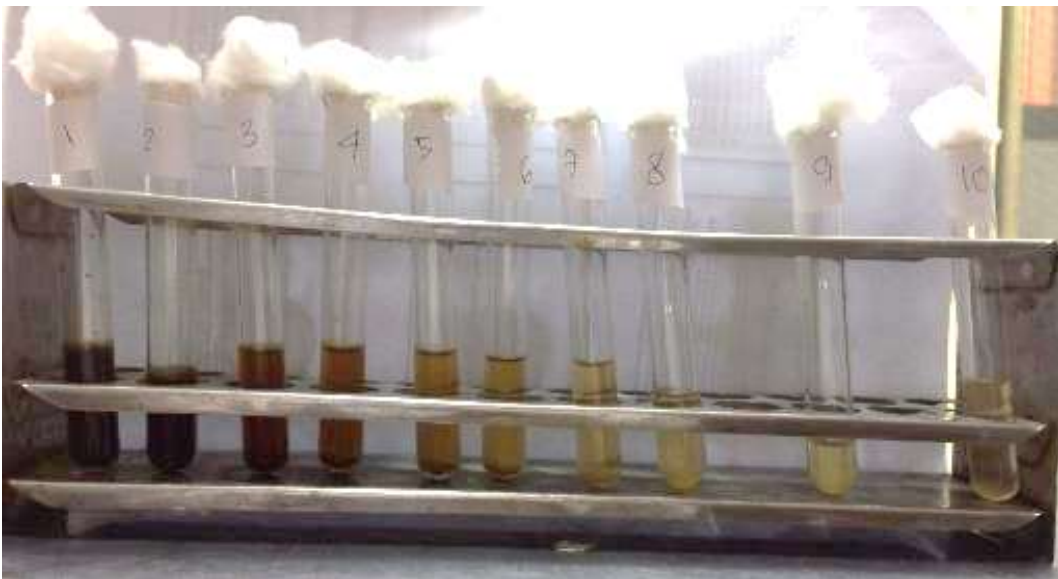
Pengujian III Dilusi Cair Setelah Inkubasi