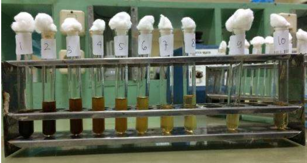
Pengujian I Dilusi Cair Sebelum Inkubasi