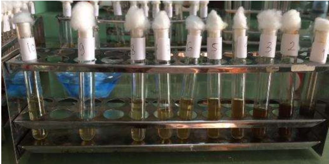
Pengujian II Dilusi Cair Sebelum Inkubasi