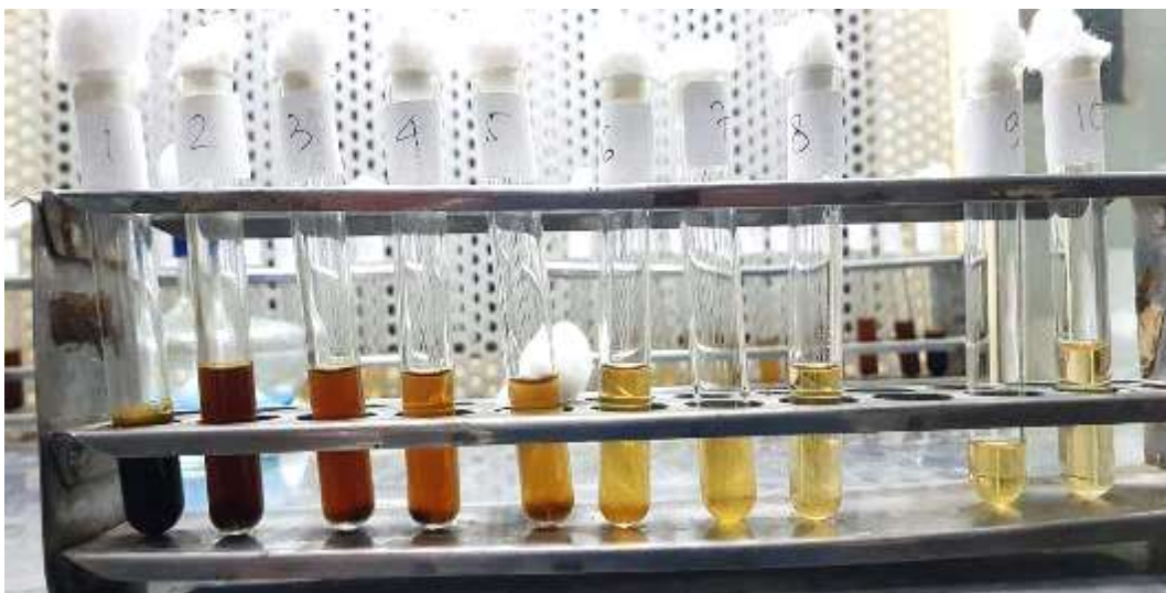
Pengujian I Dilusi Cair Setelah Inkubasi