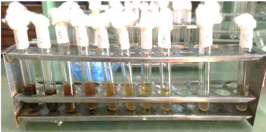
Pengujian III Dilusi Cair Sebelum Inkubasi