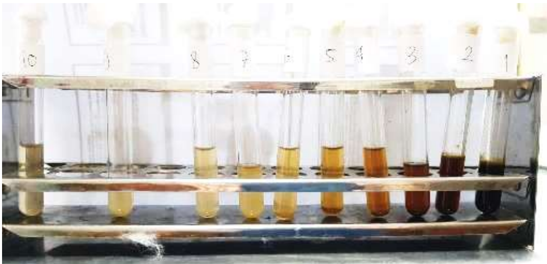
Pengujian II Dilusi Cair Setelah Inkubasi