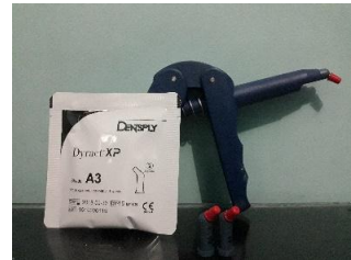
Kompomer (Dyract XP)