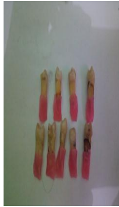
Gigi sebelum direndam dalam methylene blue