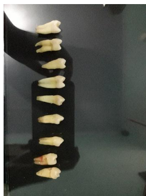
Gigi sebelum dipreparasi