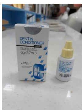
Dentin conditioner dipreparasi