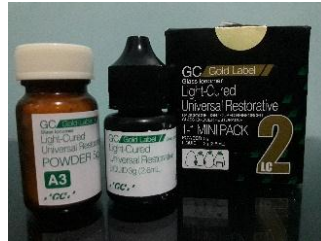
RMGIC (Tipe II, Fuji II LC, Indonesia)