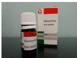
Varnish (GlassyCem, Indonesia)