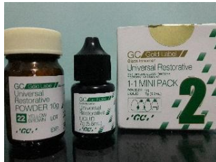
SIK Konvensional (Tipe II, Fuji II, Indonesia)