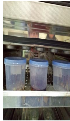
Gigi disimpan di dalam inkubator