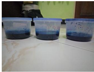
Gigi direndam di dalam gigi direndam methylen blue