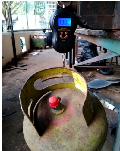
(a). Gas sebelum digunakan