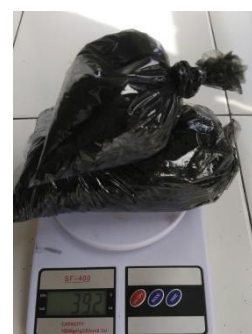
(c). Sudut 30°