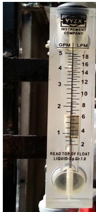
4. Flowmeter 5 GPM / 6 LPM