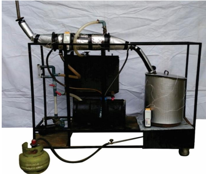
1. Instalasi Alat Pirolisis