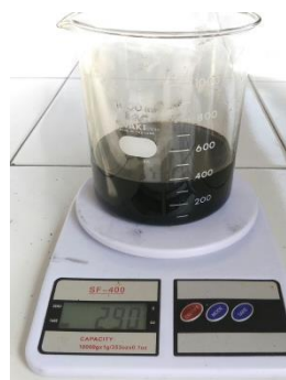
(b). Sudut 15°