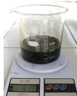
(c). Sudut 30°