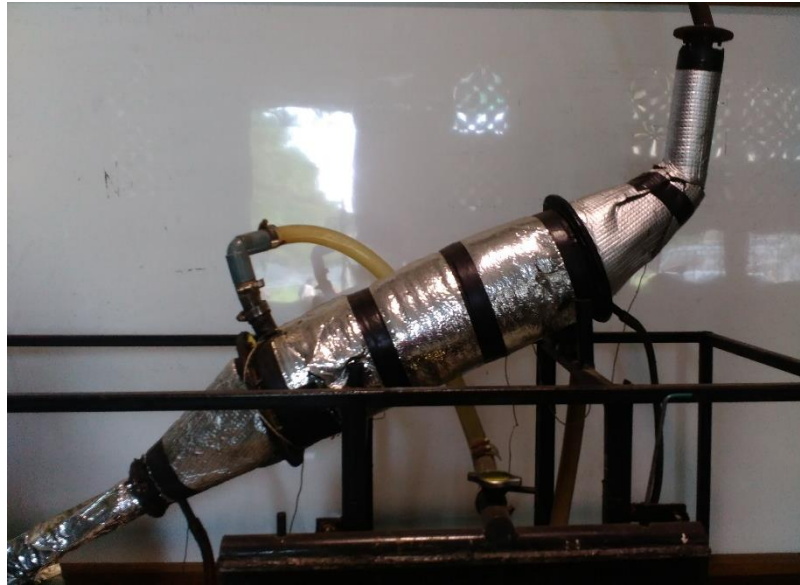
Sudut 30 0