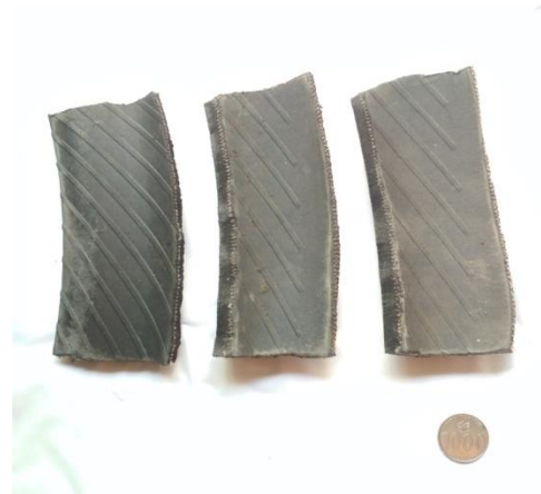
2. Bahan limbah ban yang telah dipotong 12x5 cm