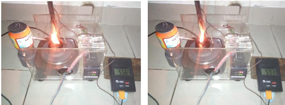
11. Pengujian flash point