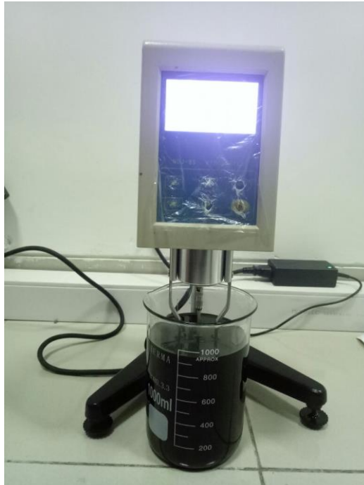
10. Pengujian Viskositas