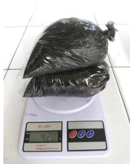
(a). Sudut 0°