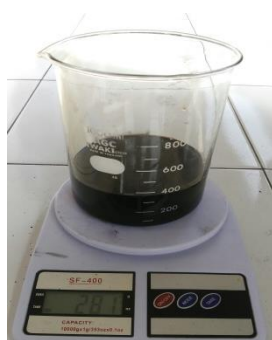
(a). Sudut 0°