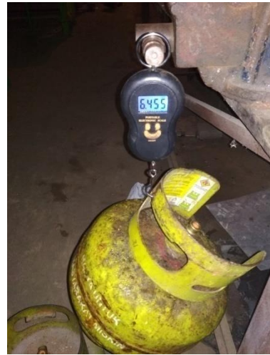
(b). Gas setelah digunakan