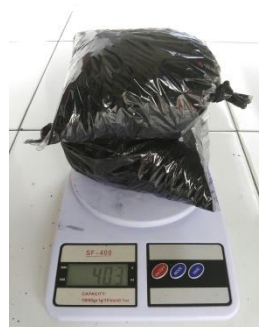
(b). Sudut 15°