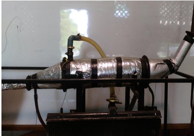
Sudut 0 0