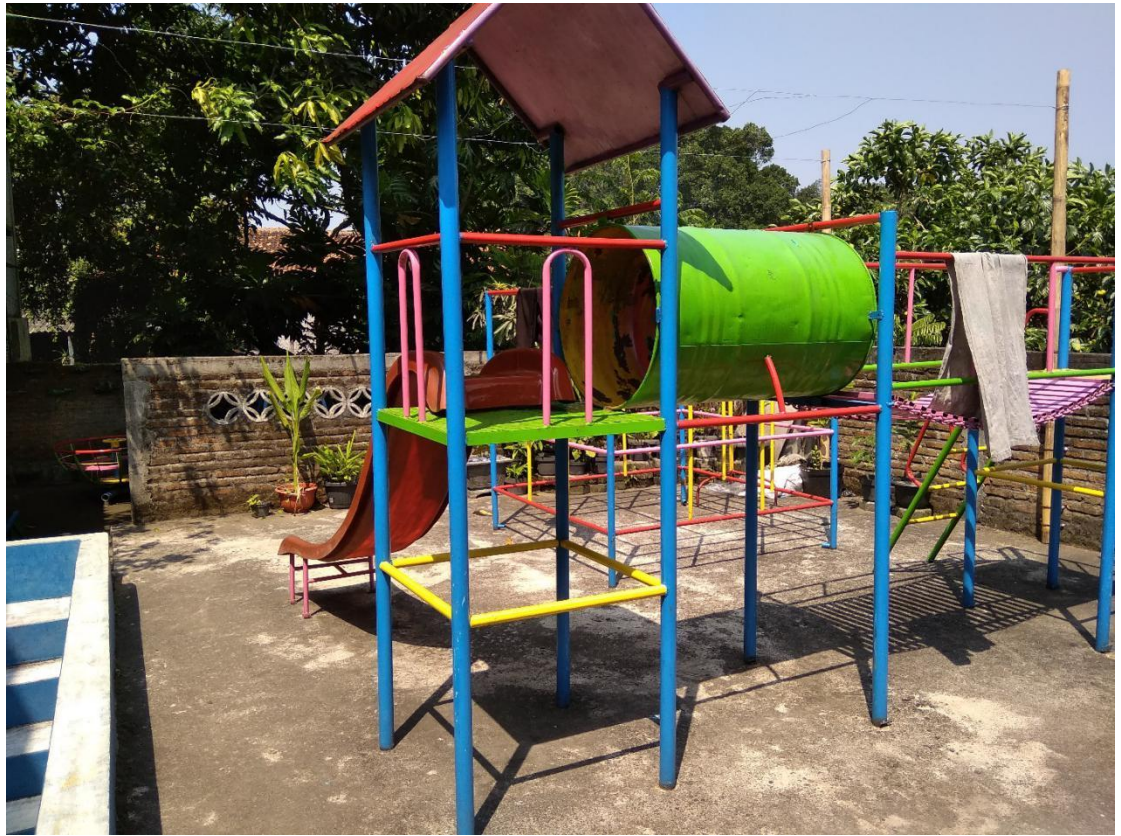
Gambar 1.5 Ruang Bermain TK Busthanul Ahtfal Aisyiyah Gendingan Yogyakarta