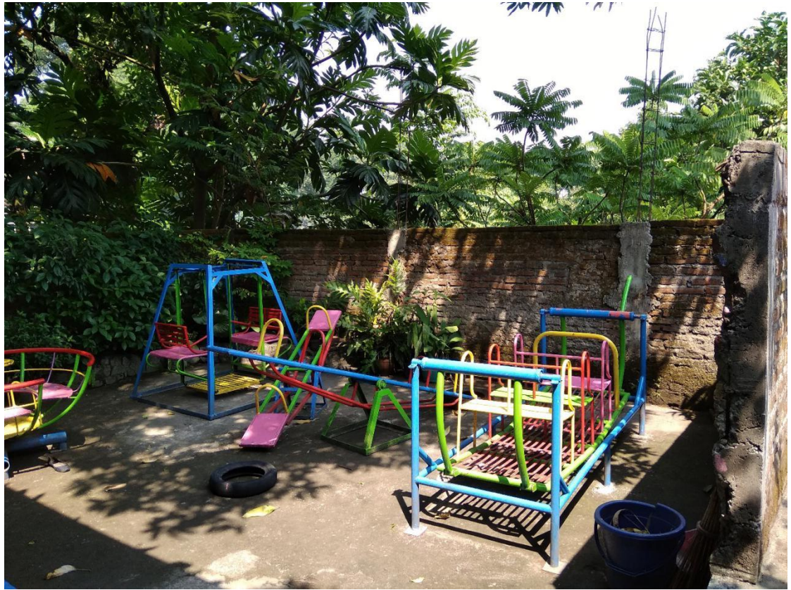
Gambar. 4 ruang bermain