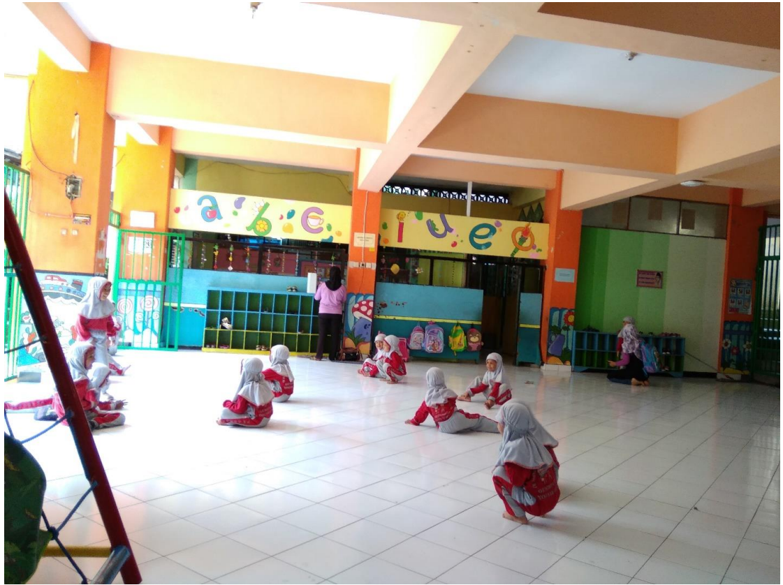
Gambar.4 Proses belajar mengajar