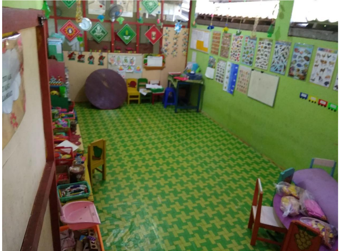
Gambar 1.3 Ruang Belajar Mengajar TK Busthanul Ahtfal Aisyiyah Gendingan