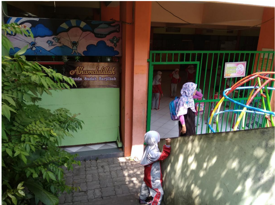
Gambar. 1.1 Pintu Masuk TK Busthanul Ahtfal Aisyiyah Gendingan Yogyakarta