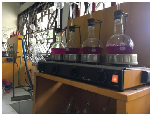
e. Analisis Laboratorium