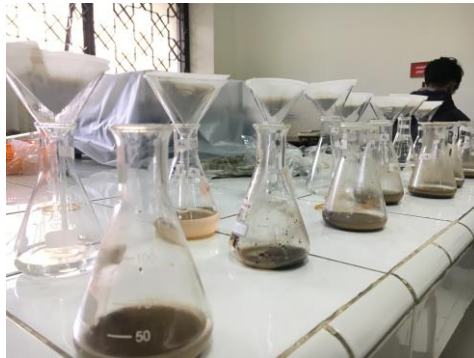
g. Analisis Laboratorium