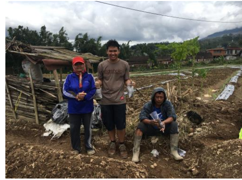
d. Pengambilan sampel tanah