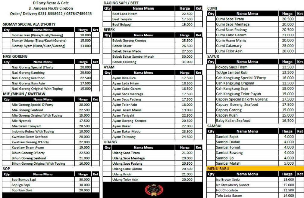
Gambar 2.5 Daftar Menu D'forty Resto And Cafe