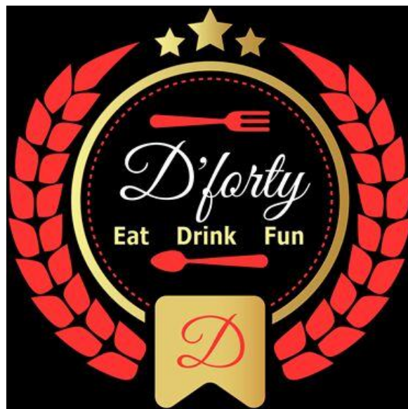
Gambar 2.2 logo D'Forty Resto and Cafe