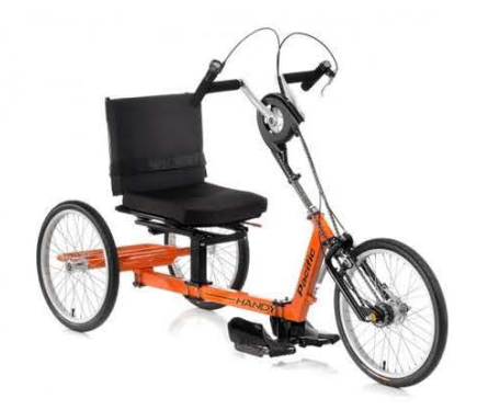
Gambar 2.1