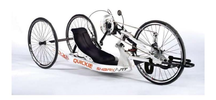
Gambar 2.2