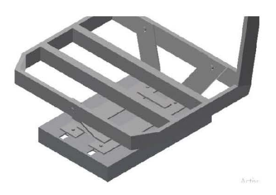
Gambar 2.5 Seat Slide