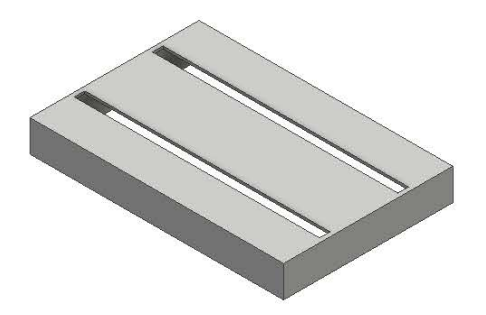
Gambar 2.3 Rail Frame

Perancangan kursi handcycle, Rail Frame dan dudukan Slide dibuat dengan software Autodesk Inventor 2016 dengan diberi dimensi dimasing-masing sisi kursi tersebut. Berikut hasil gambar desainnya: