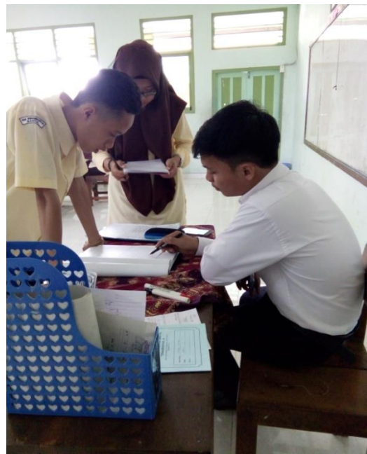
Metode privat bersama guru dalam mengatasi kesulitan yang dihadapi siswa