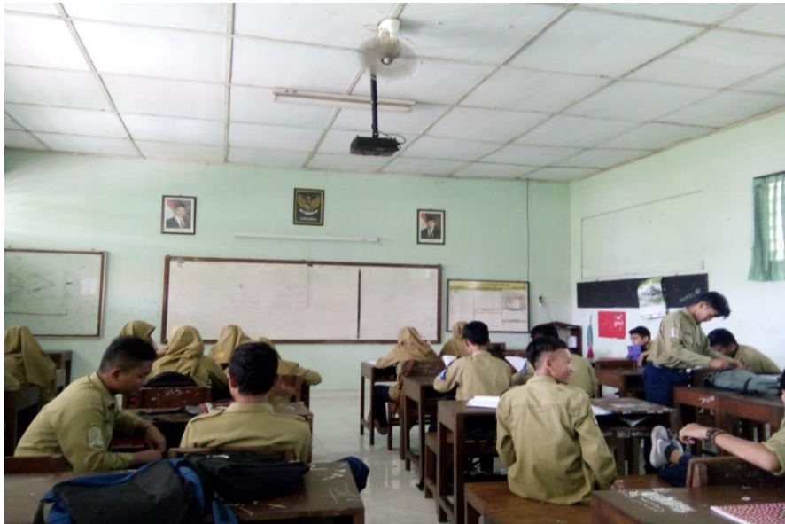
Suasana proses pembelajaran di kelas