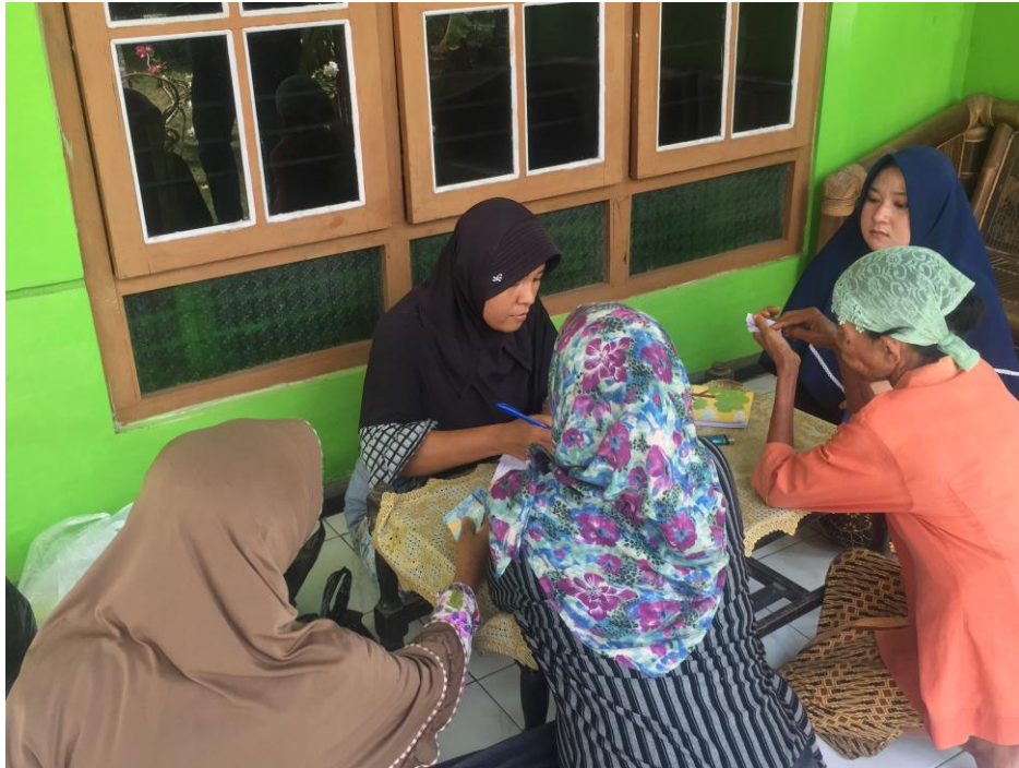
Gambar 1.5 Pelaksanaan Praktik Arisan Bahan Pokok Desa Tulusrejo, Grabag, Purworejo, Jawa Tengah.