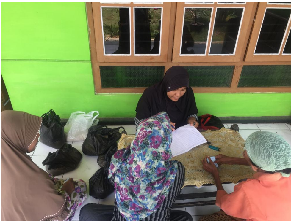
Gambar 1.6 Pelaksanaan Praktik Arisan Bahan Pokok Desa Tulusrejo, Grabag, Purworejo, Jawa Tengah.