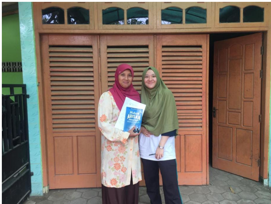
Gambar 1.2 Wawancara dengan Salah Satu Pengurus Ketua Praktik Arisan Bahan Pokok Desa Tulusrejo, Grabag, Purworejo, Jawa Tengah.