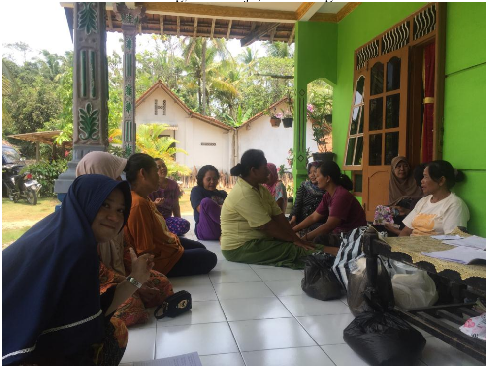
Gambar 1.4 Pelaksanaan Praktik Arisan Bahan Pokok Desa Tulusrejo, Grabag, Purworejo, Jawa Tengah.