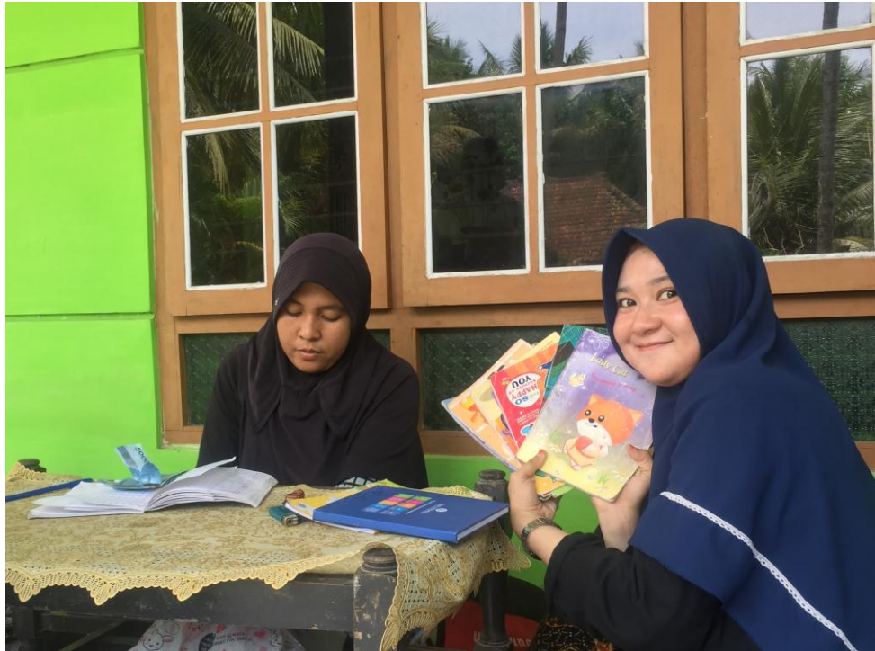
Gambar 1.3 Pelaksanaan Praktik Arisan Bahan Pokok Desa Tulusrejo, Grabag, Purworejo, Jawa Tengah.