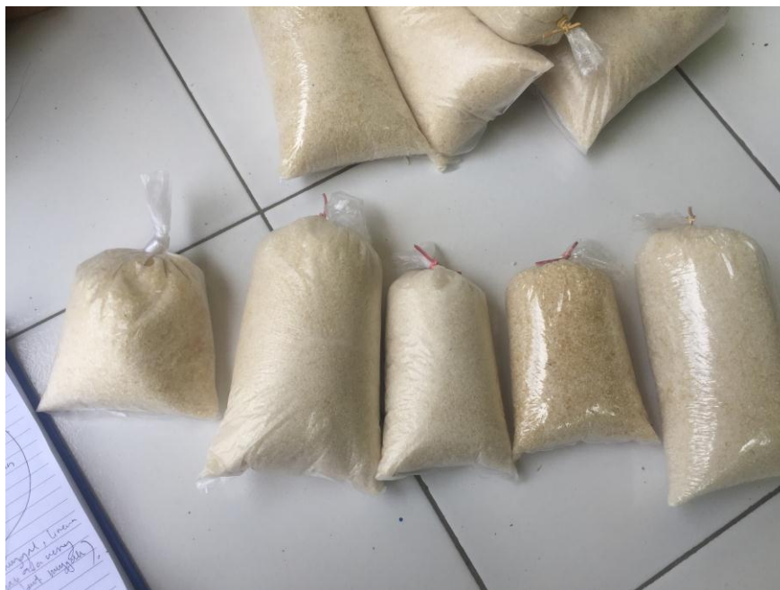
Gambar 1.10 Pengumpulan Bahan Pokok Arisan Desa Tulusrejo, Grabag, Purworejo, Jawa Tengah.