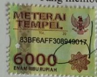
Talitha Nurmala Luthfi