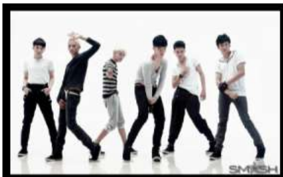
Gambar 17 Personel SM*SH

Konteks romantis, wangi, bersih dan glamour bisa juga direpresentasikan pada bentuk yang cenderung kalem dan halus, yang pada level visualnya cenderung memperlihatkan konteks feminine. Seperti pada boyband Indonesia Sm*sh yang juga menggunakan setting putih pada video musik pertamanya.