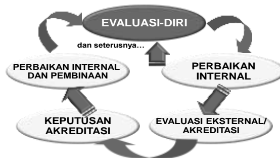
Bagan 1. Daur Penjaminan Mutu dalam Rangka Akreditasi

Seperti dikemukakan terdahulu, evaluasi-diri merupakan salah satu aspek penting dalam keseluruhan daur akreditasi dengan berbagai peran dan kegunaannya, termasuk penjaminan mutu ( quality assurance ). Keseluruhan daur penjaminan mutu dalam rangka akreditasi program studi/ perguruan tinggi itu dilukiskan dalam Bagan 1.