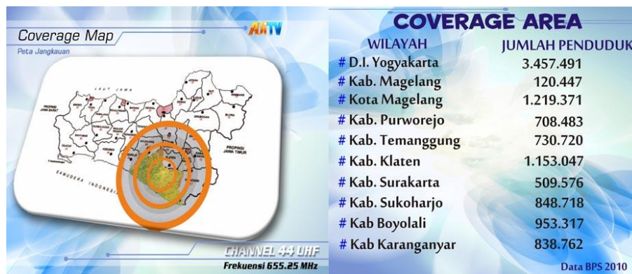
Gambar 1 : Jangkauan Siaran ADITV Yogyakarta