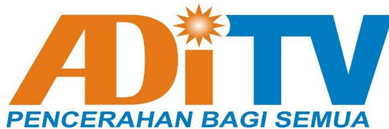
Gambar 3: Logo ADITV Yogyakarta